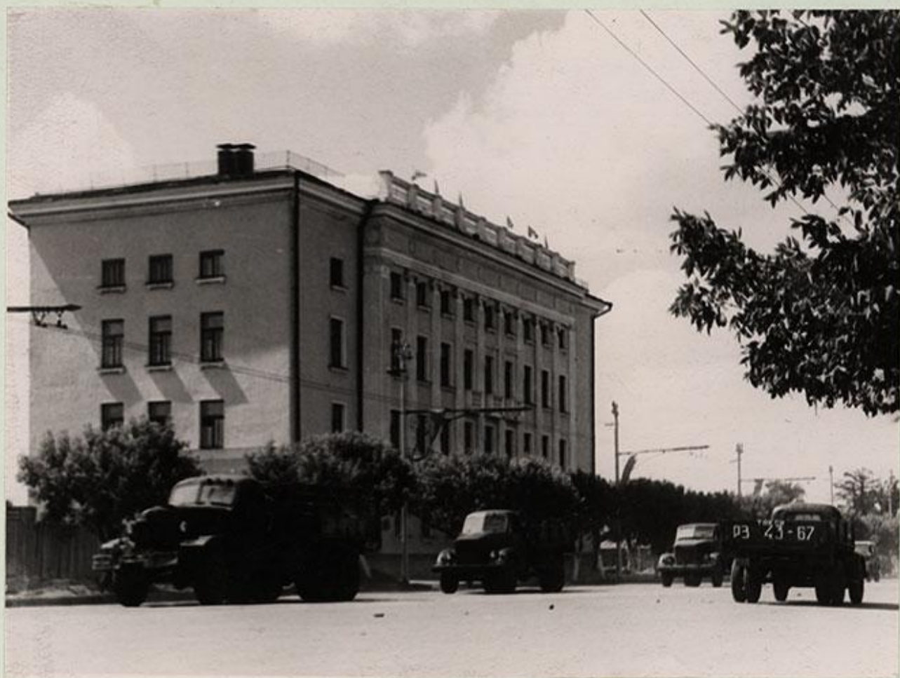
г. Рязань. Дом областного Совета профсоюзов, построенный в 1955 году.