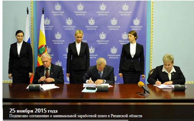
25 ноября 2015 года Подписано соглашение о минимальной заработной плате в Рязанской области