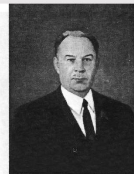
Шелепин А.Н. (1967-1975 гг.)