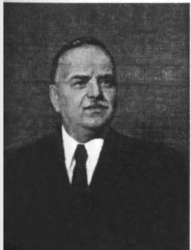
Шверник Н.М. (1930-1944, 1953-1956 гг.)