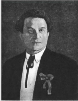
Зиновьев Г.Е. (январь-март 1918 г.)