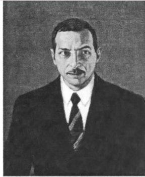
Томский М.П. (1918-1929 гг.)