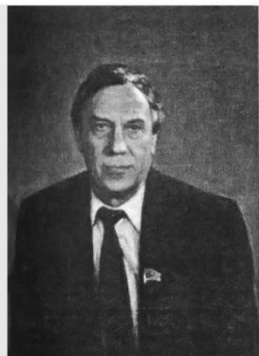
Янаев Г.И. (январь-сентябрь 1990 г.)