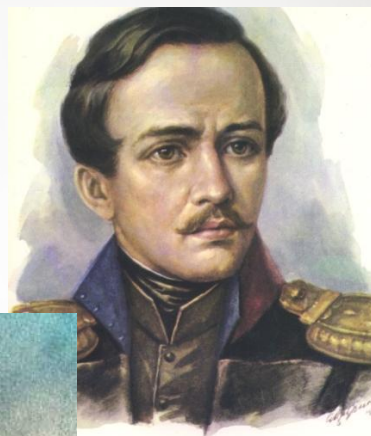
Михаил Юрьевич Лермонтов (1814—1841)

❖ Н.В.Гоголь («Вечера на хуторе близ Диканьки»)