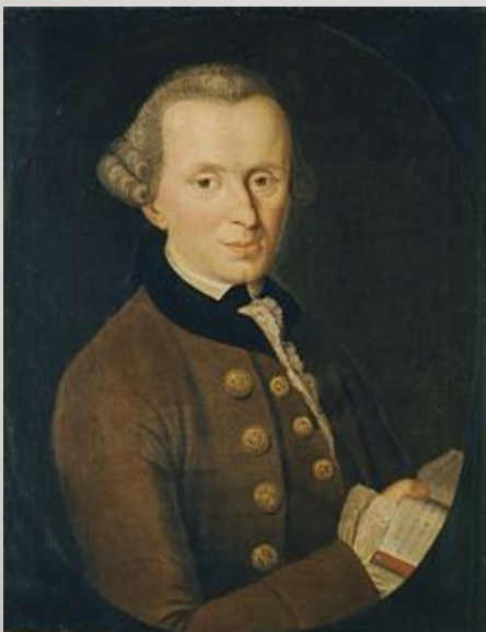
Кант Иммануил, немецкий философ