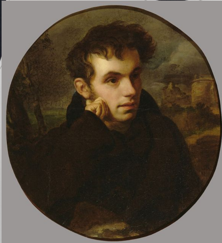
О. А. Кипренский, портрет Василия Андреевича Жуковского, 1815, Третьяковская галерея.

РОМАНТИЗМ - идейное и художественное направление в европейской и американской культуре конца XVIII века — первой половины XIX века. Распространилось на различные сферы деятельности человека. В XVIII веке романтизмом называли всё странное, живописное и существующее в книгах, а не в действительности. Зародился во Франции и Англии