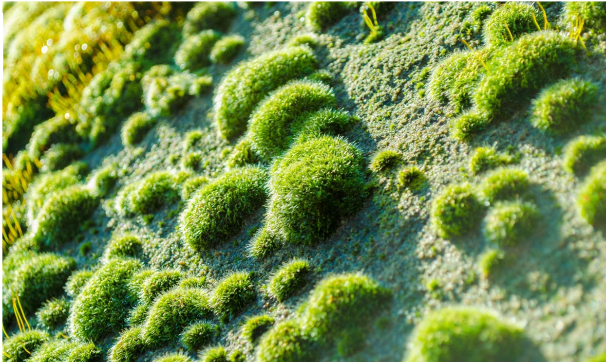
Мох и его участие в почвообразовании