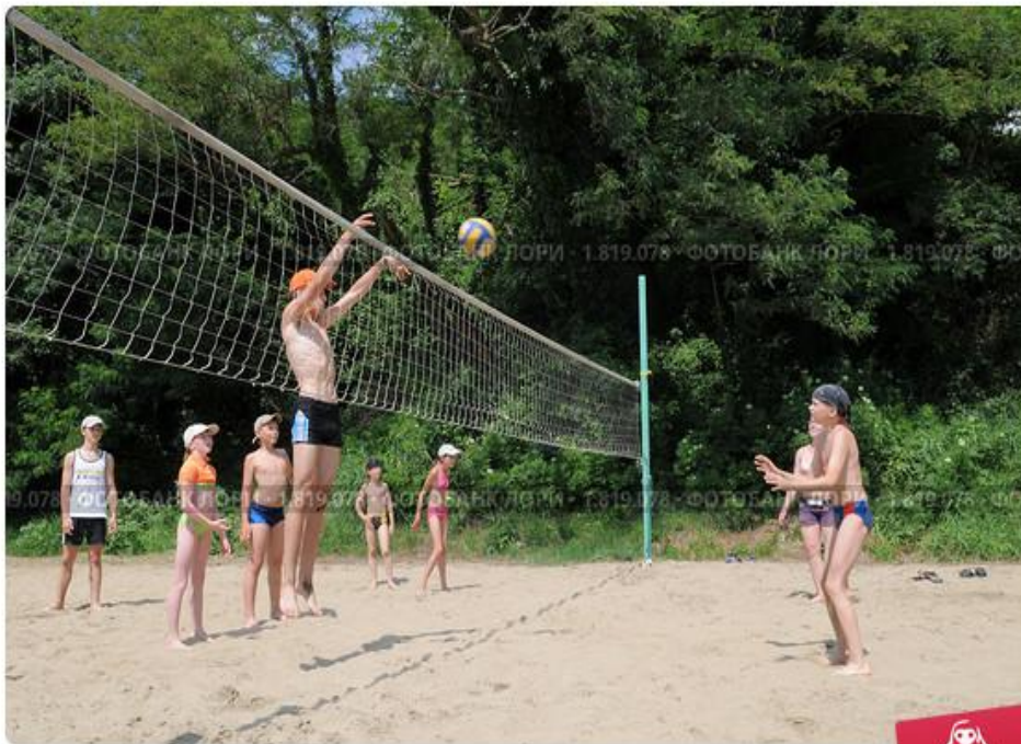
Дети играют в волейбол