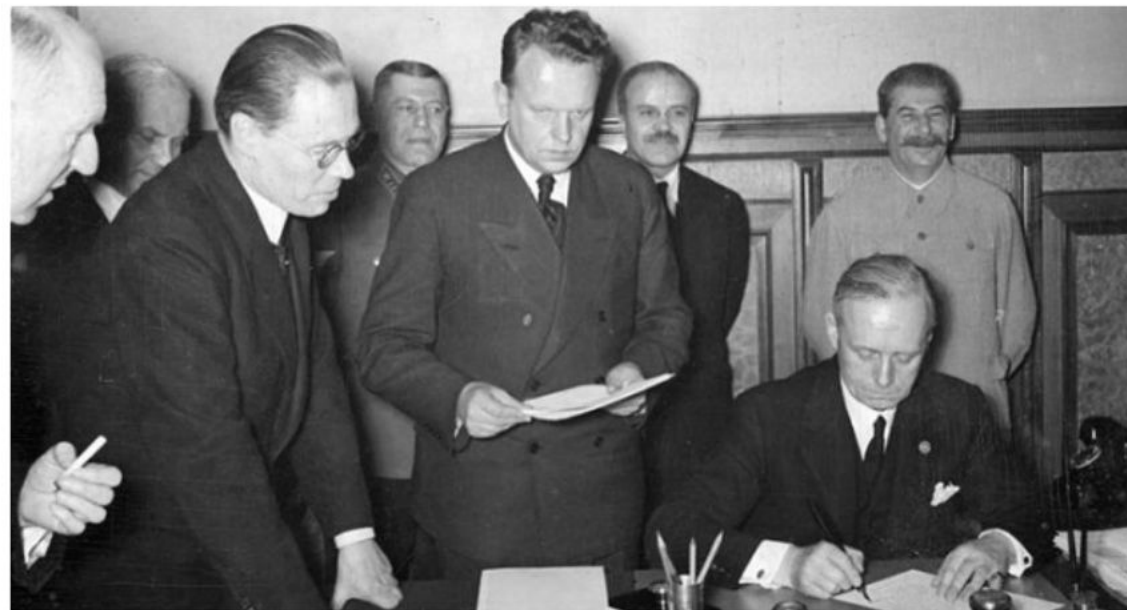
Иоахим фон Риббентроп подписывает германо-советский договор о дружбе и границе

Этот договор окончательно и четко закреплял договоренности, которые были достигнуты между нацистским Рейхом и Советским Союзом в результате заключенного 23 августа того же года пакта «Молотова — Риббентропа».