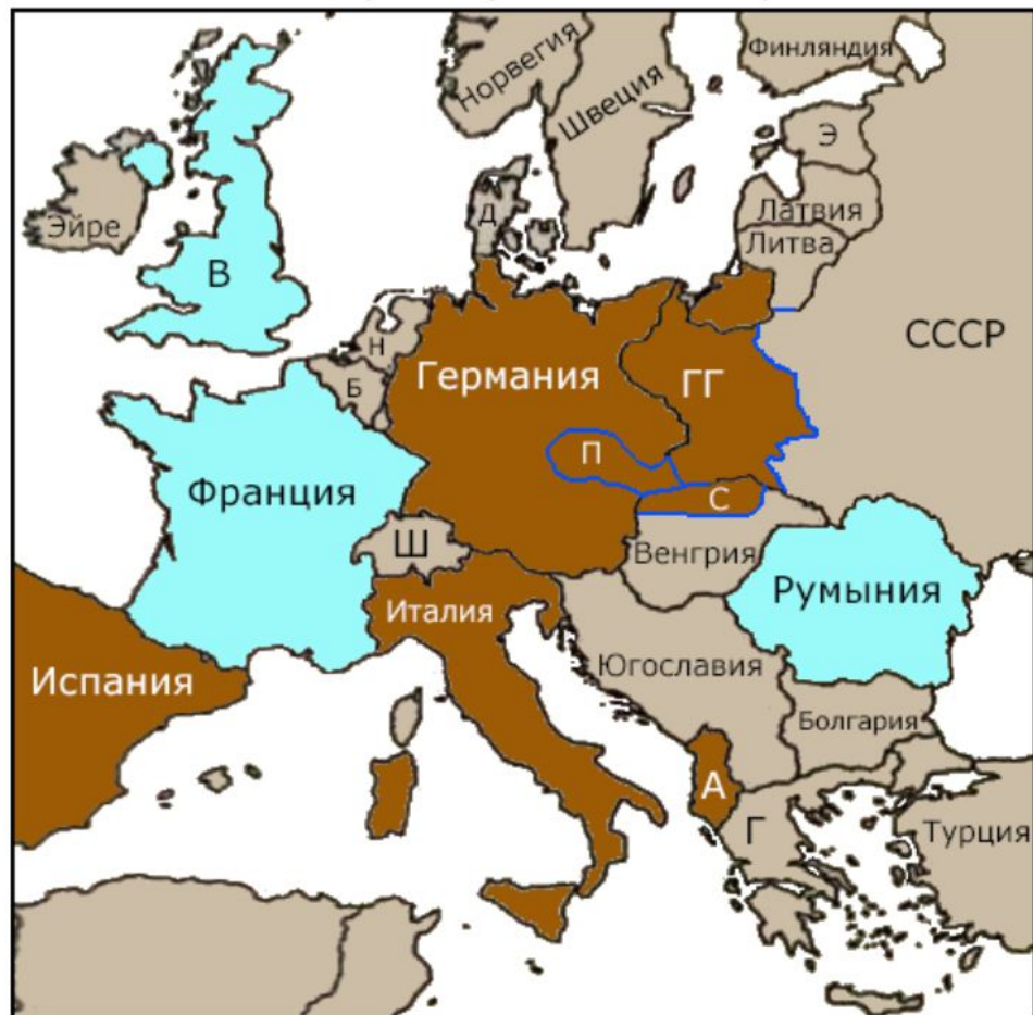
Политическая карта Европы. 1 октября 1939 года