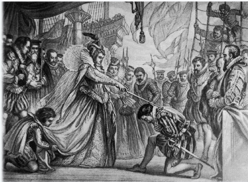
Английская королева Елизавета I посвящает в рыцари пирата Ф. Дрейка

Средневековое рыцарство сформировалось в Европе в IX—X вв. К концу XI в. сложился рыцарский этический кодекс, основывавшийся на обязательном служении Церкви, защите сирот и неимущих, воинской доблести. Покровителем рыцарей считался святой архангел Михаил — победитель дракона и предводитель ангельского воинства, окружающего престол Господа.