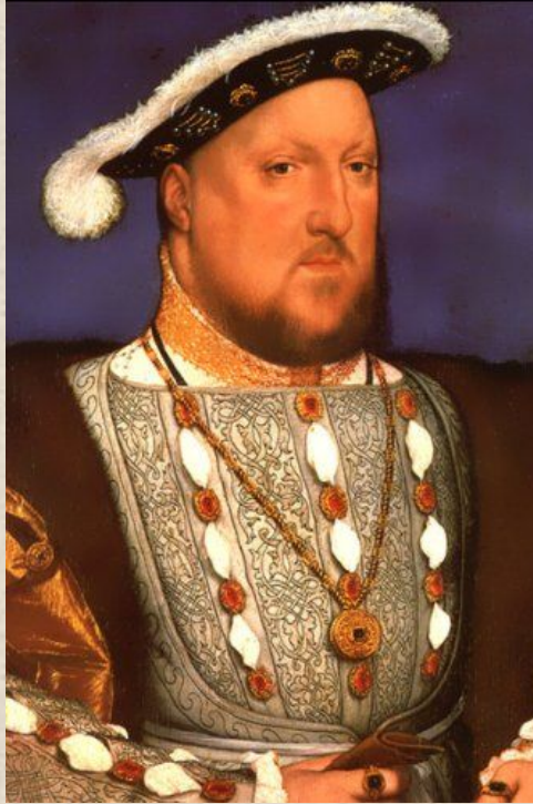
Генрих VIII 1491-1547 Тюдор

Генрих VIII будучи коронован заслужил особую признательность Папы Римского Льва X, давшего ему почетный титул «Защитника веры»