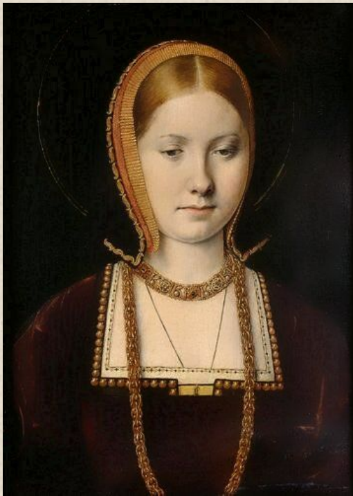
Екатерина Арагонская Первая жена, 24 года брака, дочь Мария

Король стремился произвести на свет наследника мужского пола для консолидации власти династии Тюдоров.