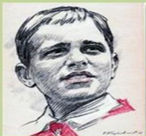
Костя Кравчук пионер-герой