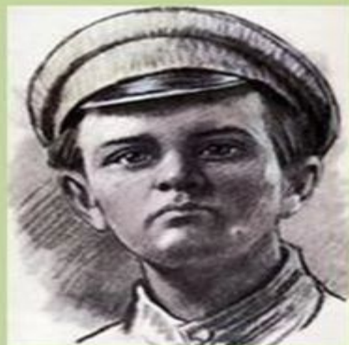
Миша Гаврилов пионер-герой