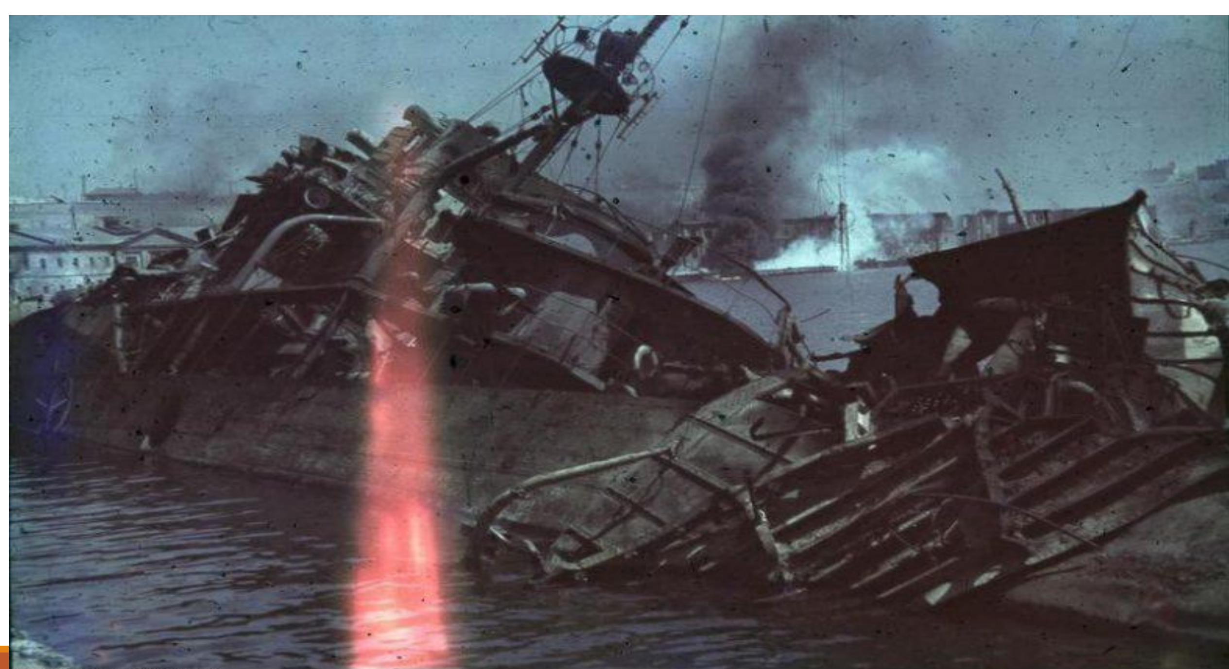
N 1603 Bild-263 Juli 1942 ca.