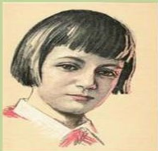
Люся Герасименко пионер-герой