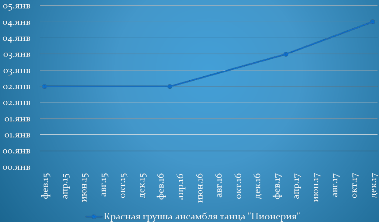
Красная группа ансамбля танца "Пионерия"