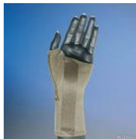
С ребром жесткости (ладонной шиной)