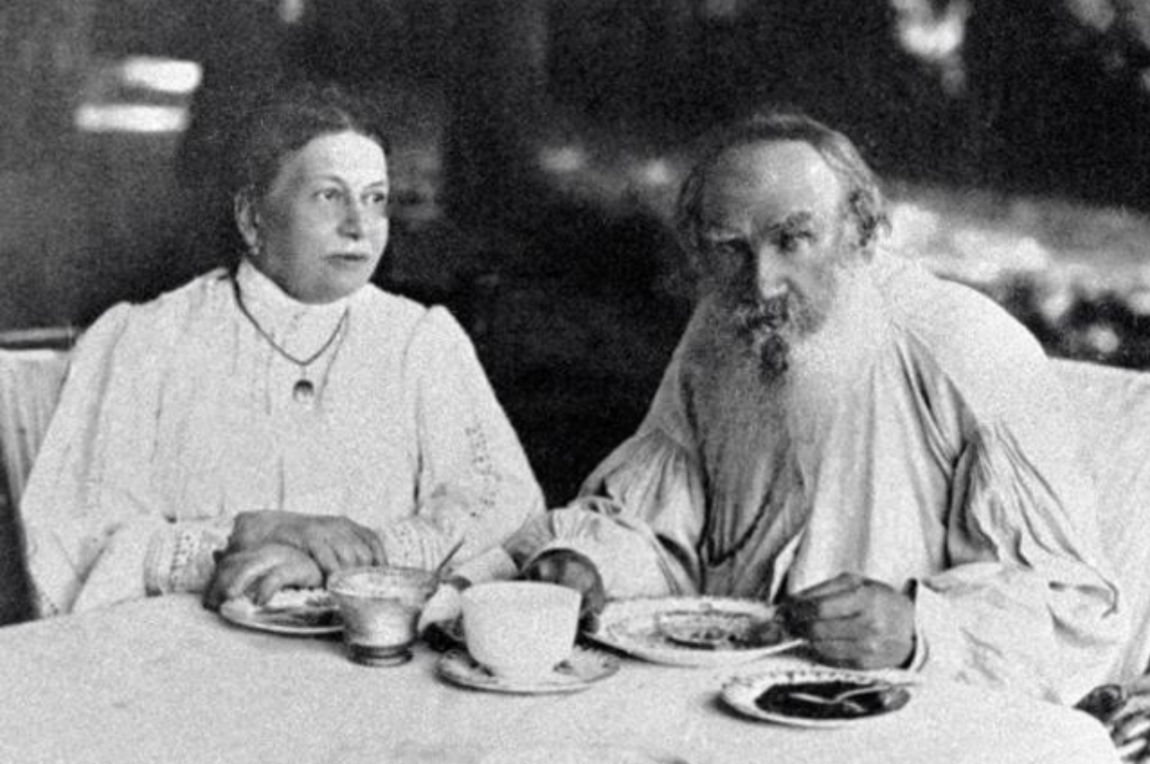
Писатель Лев Николаевич Толстой и его супруга Софья Андреевна пьют чай дома в Ясной Поляне, 1908 год.