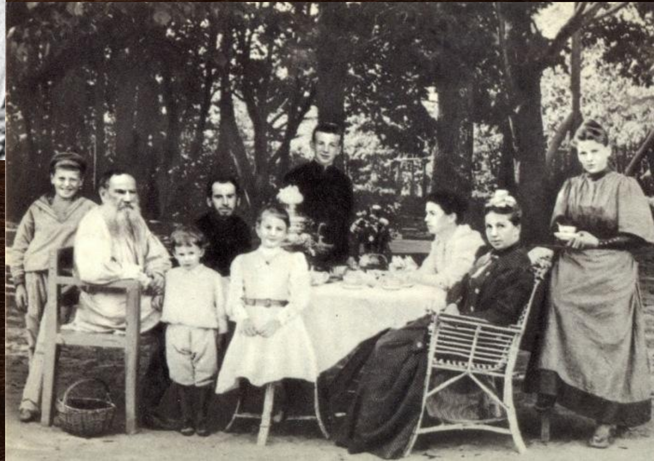
Толстой с семьей за чайным столом в парке.