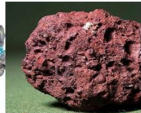
Железная и алюминиевая руды