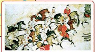
АХЛАХСКАЯ БИТВА 751 г.