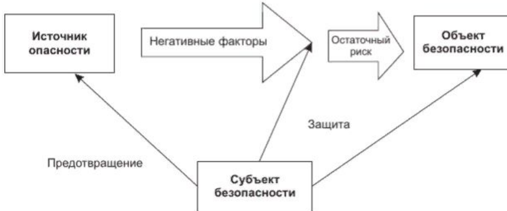
Рис. 2.1. Взаимосвязи между базовыми понятиями курса безопасности жизнедеятельности