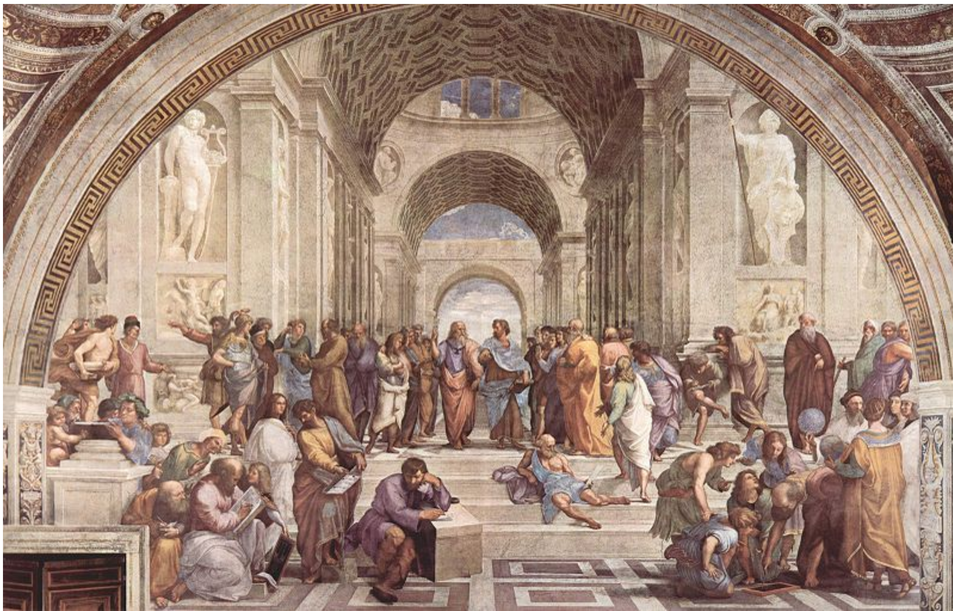
Фреска Рафаэля «Афинская школа», где рядом с Пифагором и Аристотелем изображены Леонардо и Браманте.