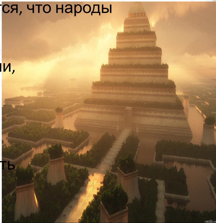
Башня в Вавилоне - реконструкция

В центре Вавилона возвышалась девяностометровая храмовая башня, с которой жрецы наблюдали за движением звезд и планет. В легенде, рассказывающей о строительстве башни, говорится, что народы говорившие тогда на одном языке начали строительство огромной башни, по которой можно было бы взобраться на небо. Но бог разгневался на людей за их дерзость – и смешал языки строителей. Перестав понимать друг друга, они не смогли закончить строительство и разбрелись по всей земле.