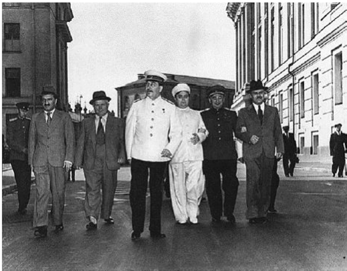
Трогательное единство. Следом за Сталиным под руку шествуют неразлучные друзья, Маленков, Берия и Молотов, рядышком — Хрущёв и, всем вождям преданный, непопулярный Микоян, которого «брежневская молодёжь» вовлечёт в заговор против Хрущёва

Вячеслав Михайлович Молотов, Лаврентий Павлович Берия, Георгий Максимилианович Маленков, Анастас Иванович Микоян, Андрей Андреевич Жданов, Николай Алексеевич Вознесенский, Алексей Александрович Кузнецов