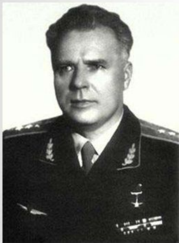
Шахурин А.И., нарком авиационной промышленности

Руководители ВВС и авиационной промышленности были обвинены в протаскивании на вооружение ВВС заведомо бракованных самолетов и моторов, что приводило к большому числу аварий. Пытка – многодневное лишение сна. Приговор: А.А.Новикову и А.И. Шахурину – 7 лет, другим подсудимым – от 3 до 6 лет лагерей.