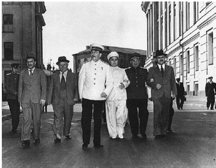
Трогательное единство. Следом за Сталиным под руку шествуют неразлучные друзья, Маленков, Берия и Молотов, рядышком — Хрущёв и, всем вождям преданный, непопулярный Микоян, которого «брежневская молодёжь» вовлечёт в заговор против Хрущёва

Вячеслав Михайлович Молотов, Лаврентий Павлович Берия, Георгий Максимилианович Маленков, Анастас Иванович Микоян, Андрей Андреевич Жданов, Николай Алексеевич Вознесенский, Алексей Александрович Кузнецов