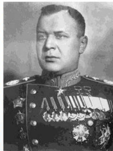
Новиков А.А., главный маршал авиации

Руководители ВВС и авиационной промышленности были обвинены в протаскивании на вооружение ВВС заведомо бракованных самолетов и моторов, что приводило к большому числу аварий. Пытка – многодневное лишение сна. Приговор: А.А.Новикову и А.И. Шахурину – 7 лет, другим подсудимым – от 3 до 6 лет лагерей.