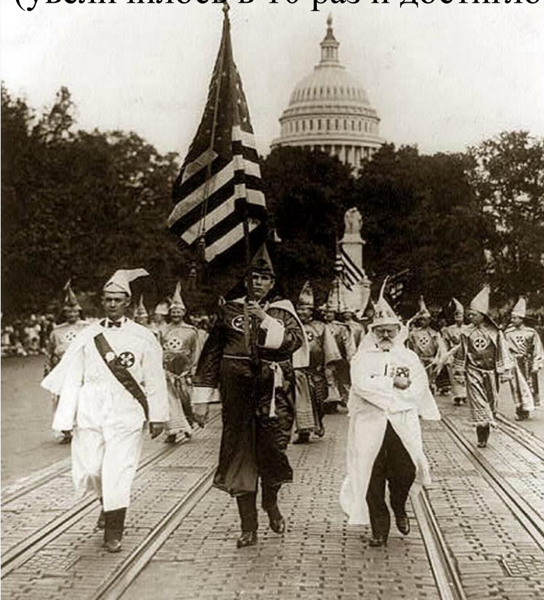
Куклуксклановцы маршируют возле Капитолия