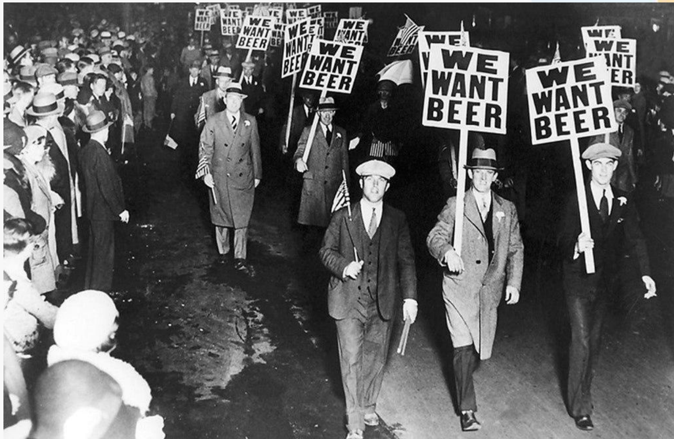
Сухой закон США 1920-1933 Отмена сухого закона в США 1920-1930