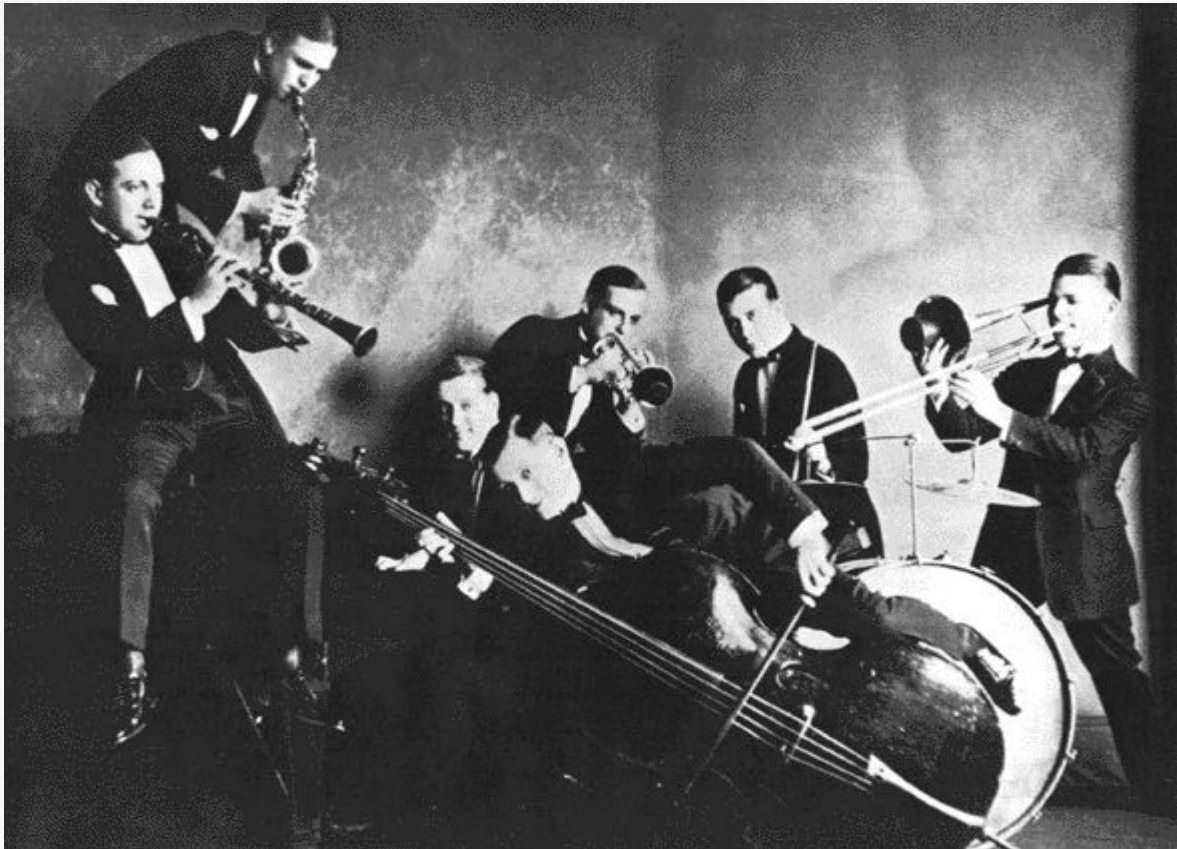
New Orleans Rhythm Kings, джаз-бенд 1920-х гг.