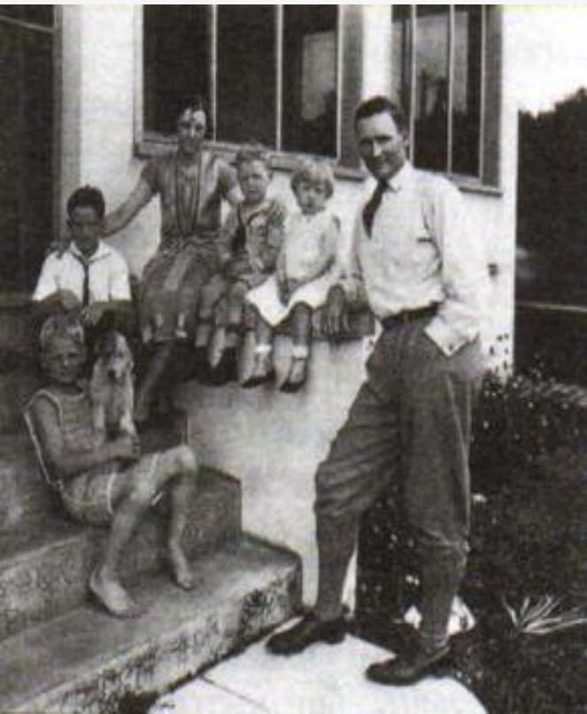
Благополучная американская семья 1920-х гг.

Из самого большого должника Европы они превратились с самого востребованного кредитора.