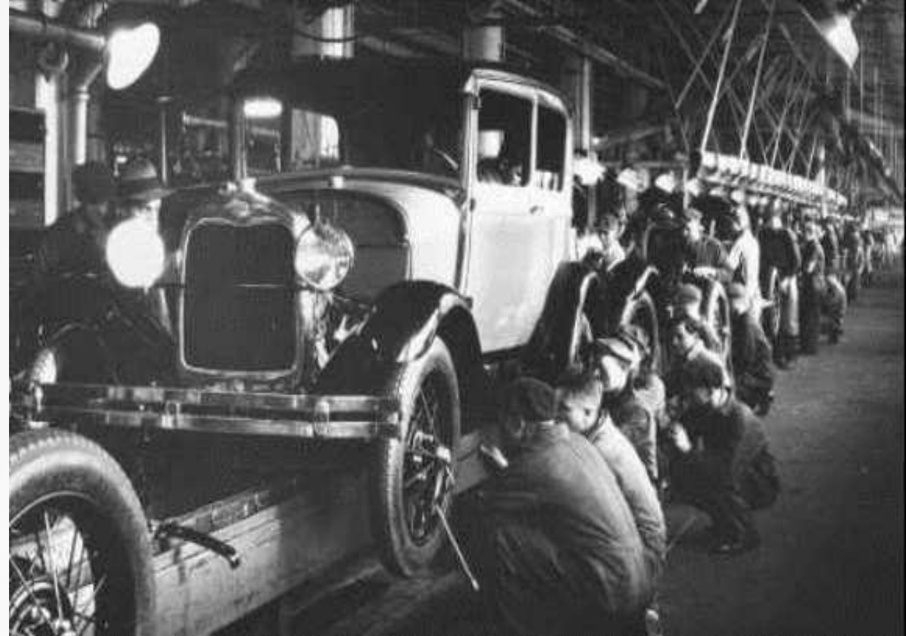
Конвейер Генри Форда

Впечатляющие успехи в развитие США породили новую веру в бескризисное государство.