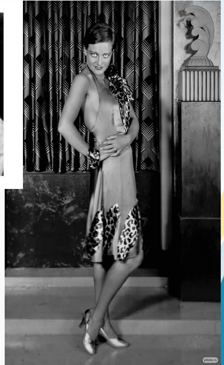
Джоан Кроуфорд, актриса