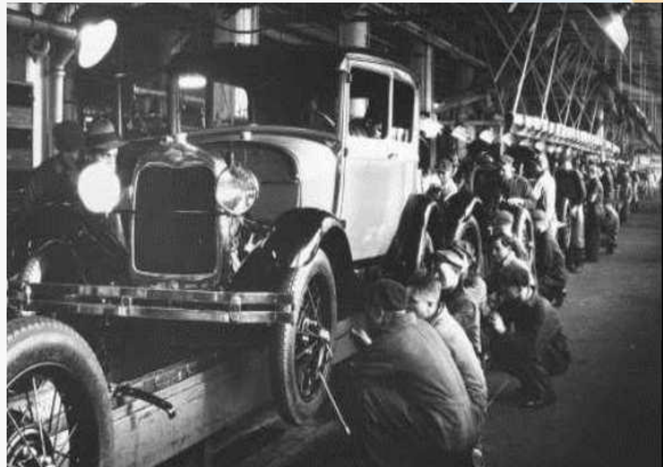
Конвейер Генри Форда

Впечатляющие успехи в развитие США породили новую веру в бескризисное государство.