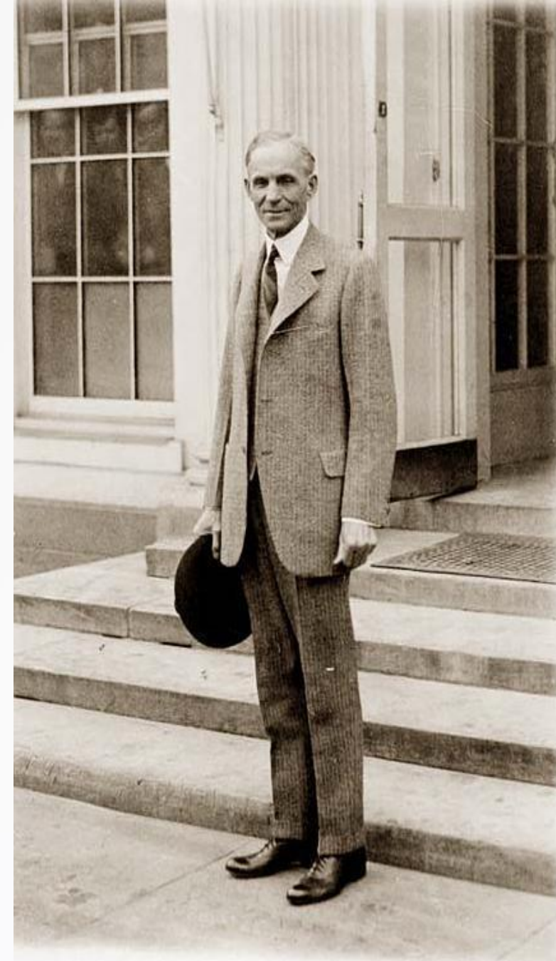
Генри Форд. 1927 год