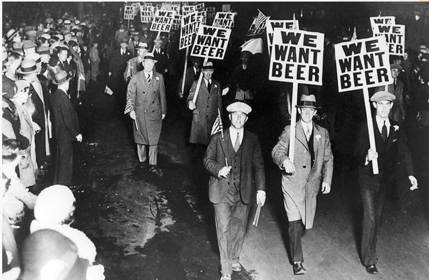
Сухой закон США 1920-1933 Отмена сухого закона в США 1920-1930