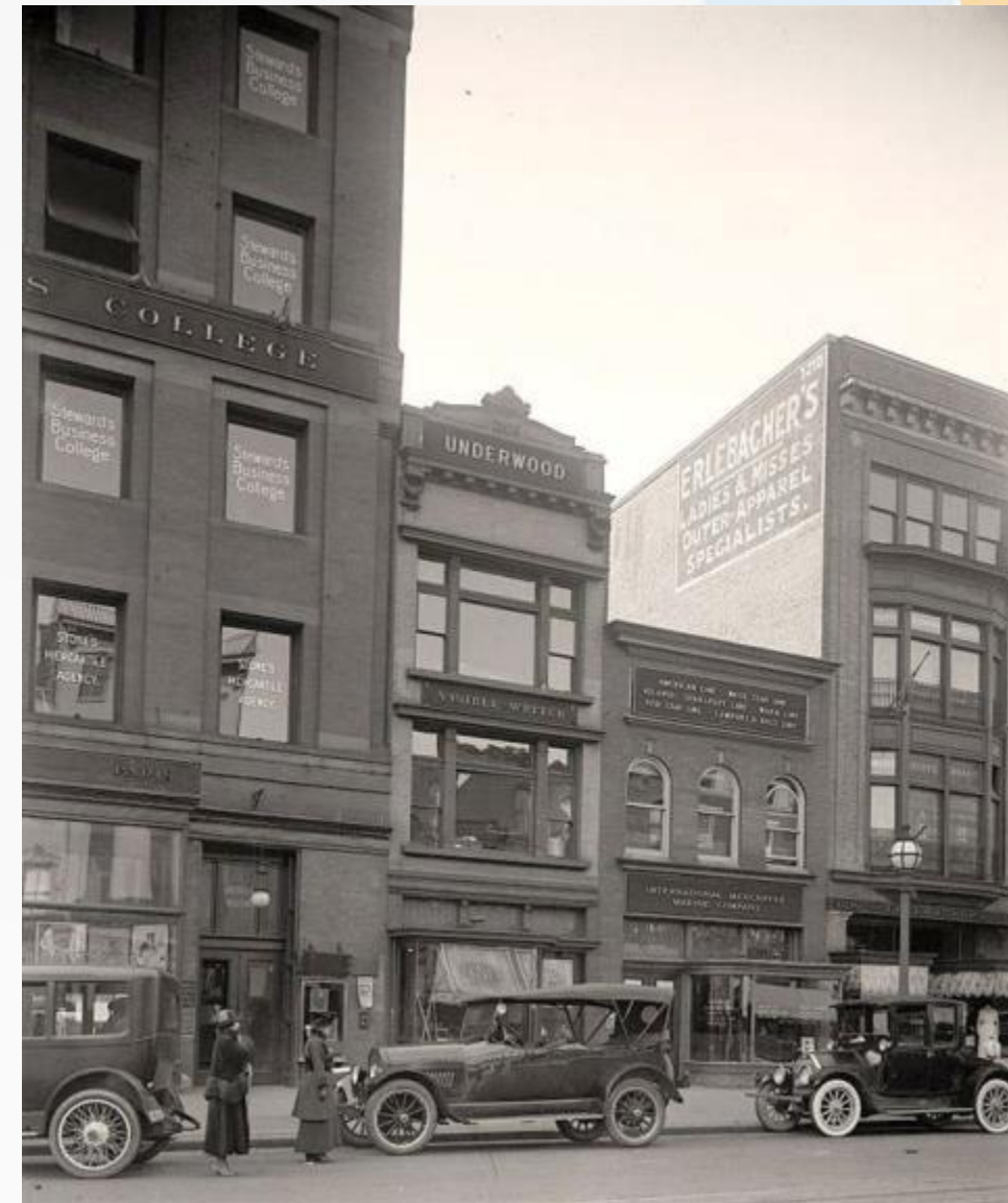
На одной из многочисленных улиц Америки. Фото: 1920-е гг.