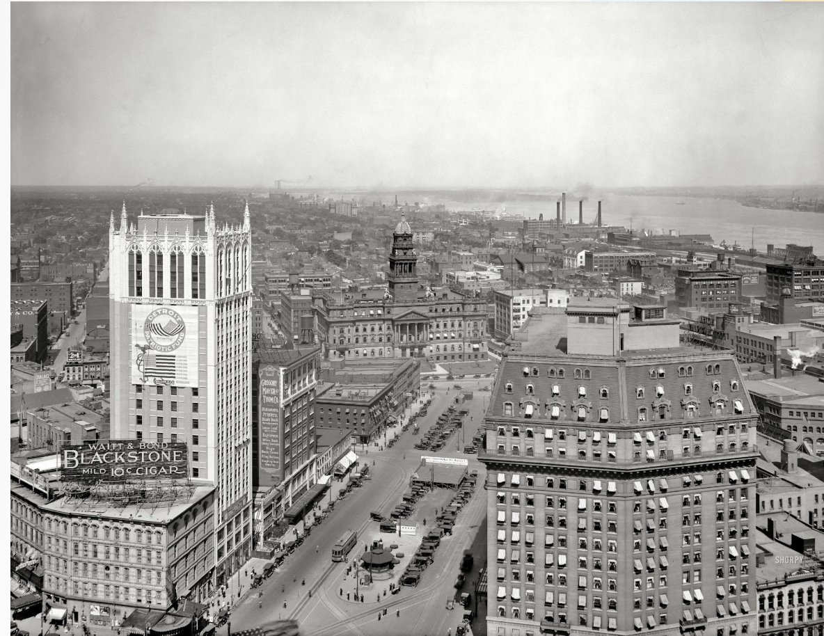
США В начале 20 века. Американские города 20 г.

В 1920-е гг. США – страна контрастов: замечательные технические нововведения, демонстрация огромных возможностей науки и техники, но также и накопление внутренних противоречий, социальных контрастов богатства и бедности.