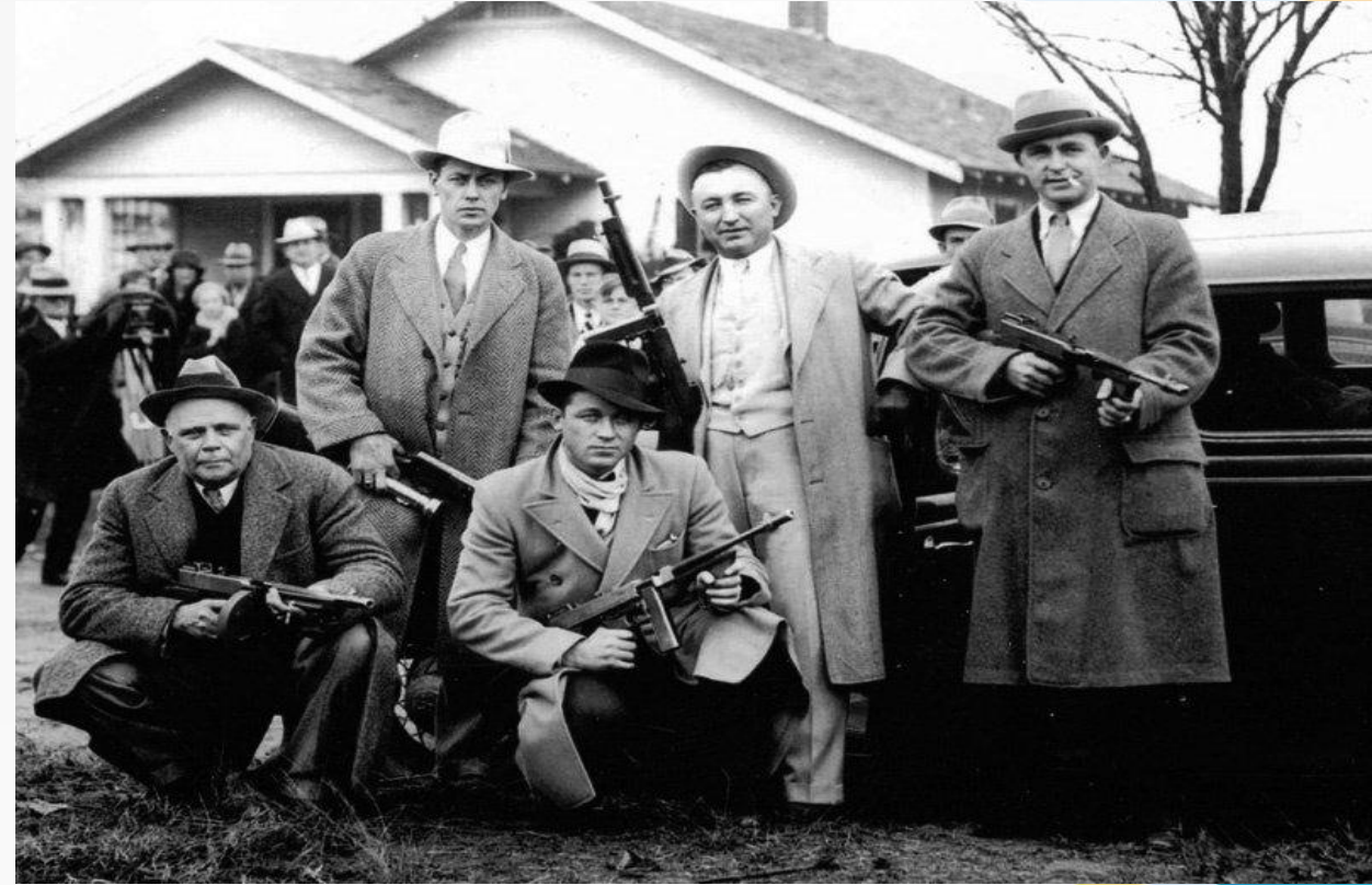
«Гангстерский вариант», США. Америка мафия 20-е, 1928г.