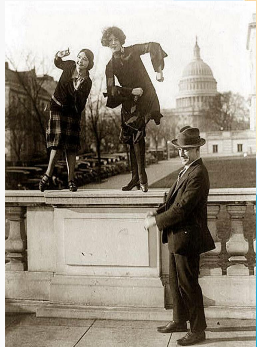
Чарльстон на фоне Капитолия. 1918 год.