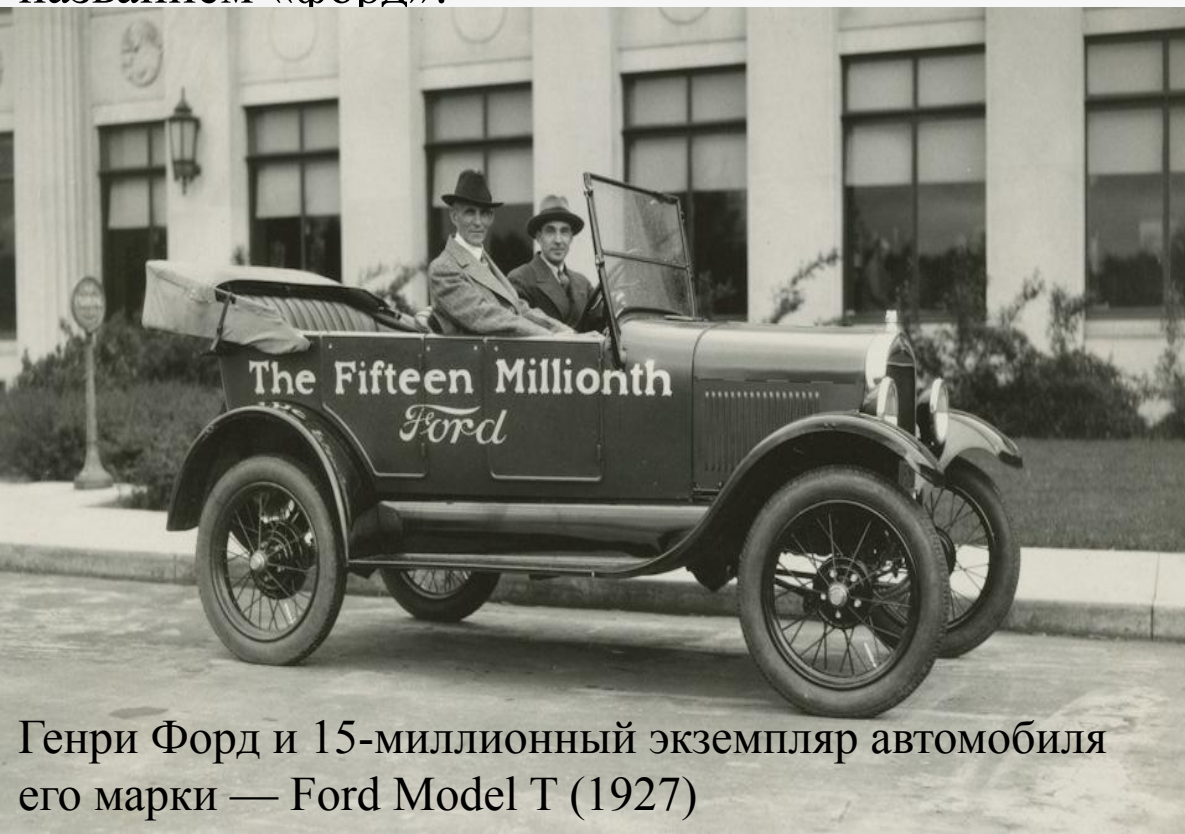
Генри Форд и 15-миллионный экземпляр автомобиля его марки — Ford Model T (1927)

В 1908 г. на фордовских заводах началось изготовление знаменитой «модели Т», получившей затем широкую известность во всем мире под названием «форд».