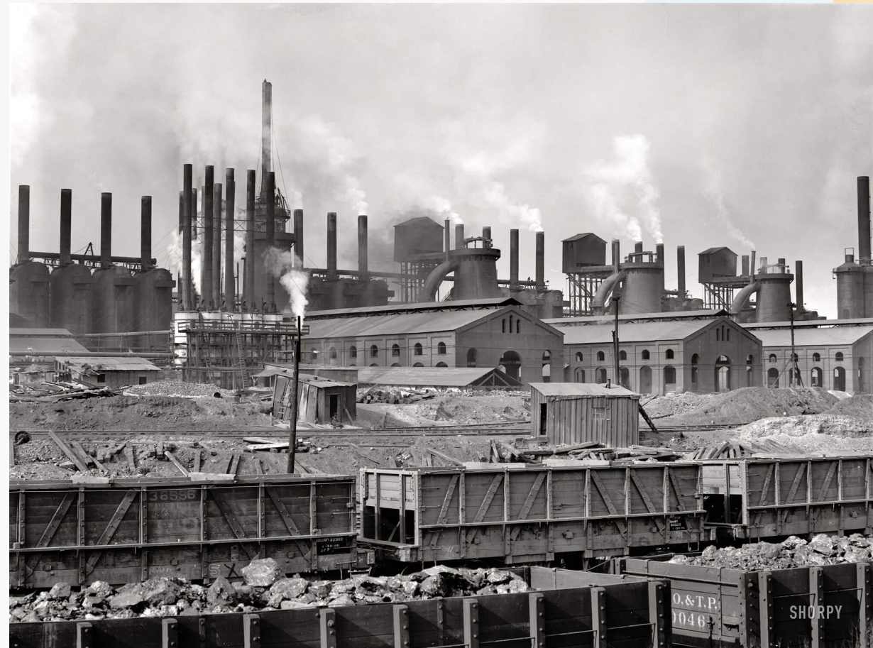
Химическая промышленность США

Для Америки это был поистине экономический бум. За это время ВВП вырос на 54 %, производство стали на 70 %, добыча нефти на 156 %, а производство автомобилей более чем в 2,5 раза. Заработная плата выросла на 33 %. В общемировом промышленном производстве доля США составляла около 45 %.