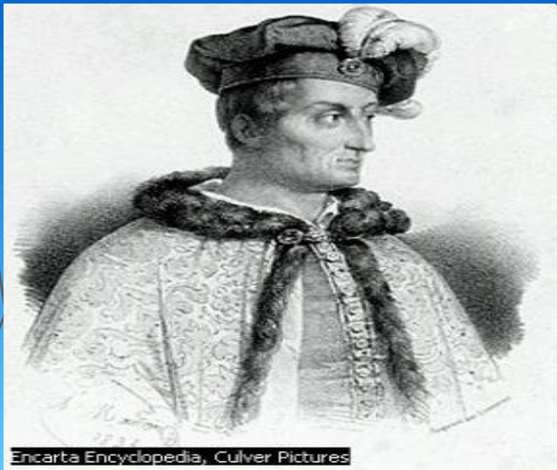
Encarta Encyclopedia, Culver Pictures