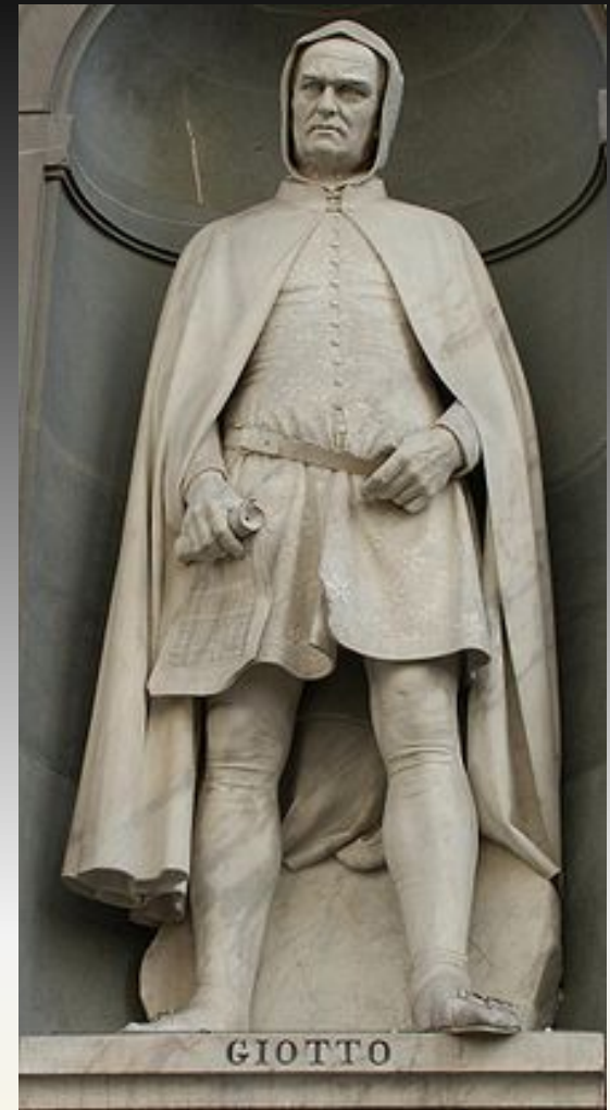
Статуя Джотто в нише пилона Флоренция,