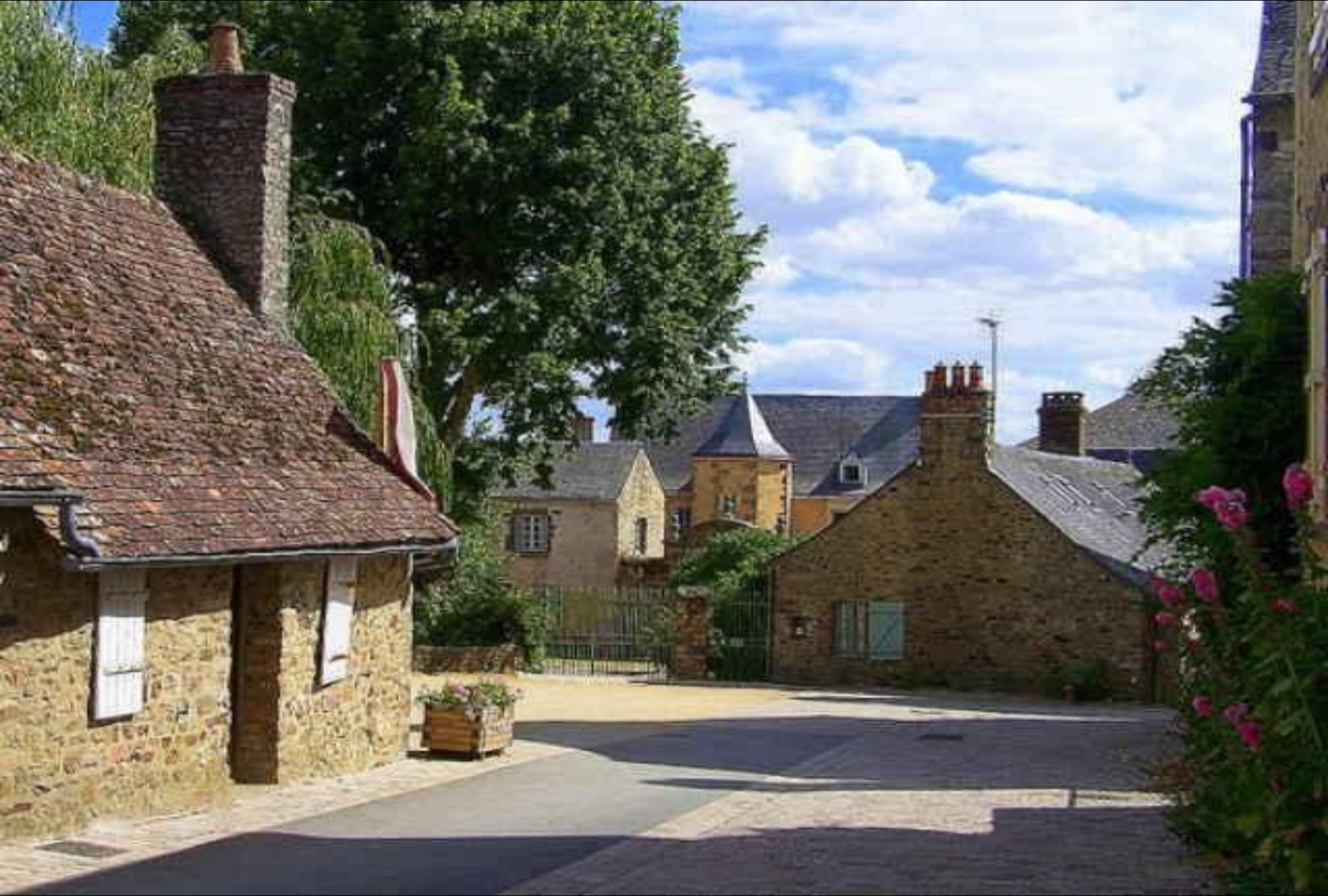
VILLAGE DE CONQUES VALLÉE DU LOT