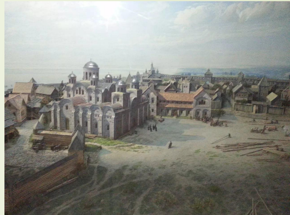
СТАРОДАВНІЙ КИЇВ X - XIII ст.