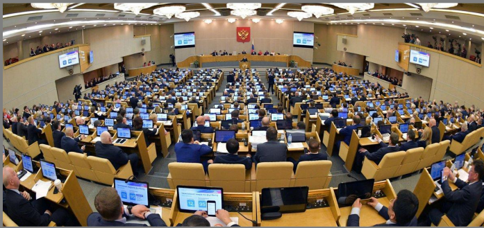
КОМИТЕТ ПО ОХРАНЕ И ЗДОРОВЬЯ ГОСУДАРСТВЕННОЙ ДУМЫ РФ