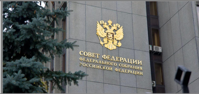
КОМИТЕТ ПО ОХРАНЕ ЗДОРОВЬЯ И НАСЕЛЕНИЯ СОВЕТА ФЕДЕРАЦИИ РФ