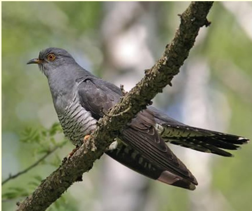
Обыкновенная кукушка-Cuculus canorus-Cuckoo.

http://nature.doublea.ru/index.php? p=100240151102