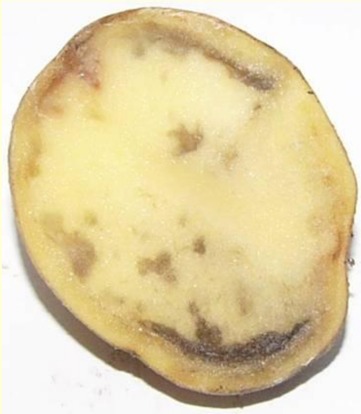
Phytophthora infestans - plisen bramborova

http://www.biolib.cz/cz/taxon/i d128812/