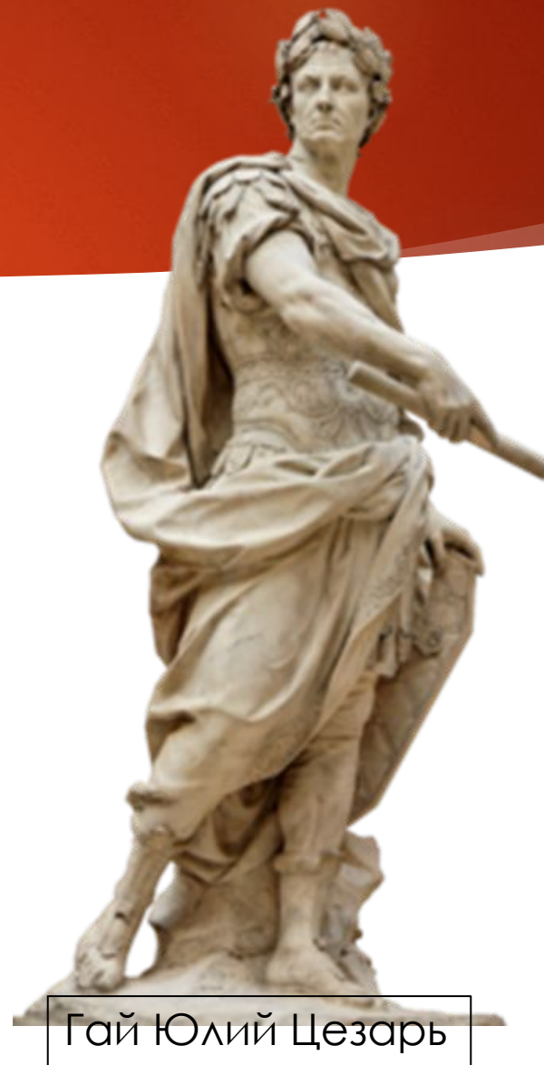
Гай Юлий Цезарь