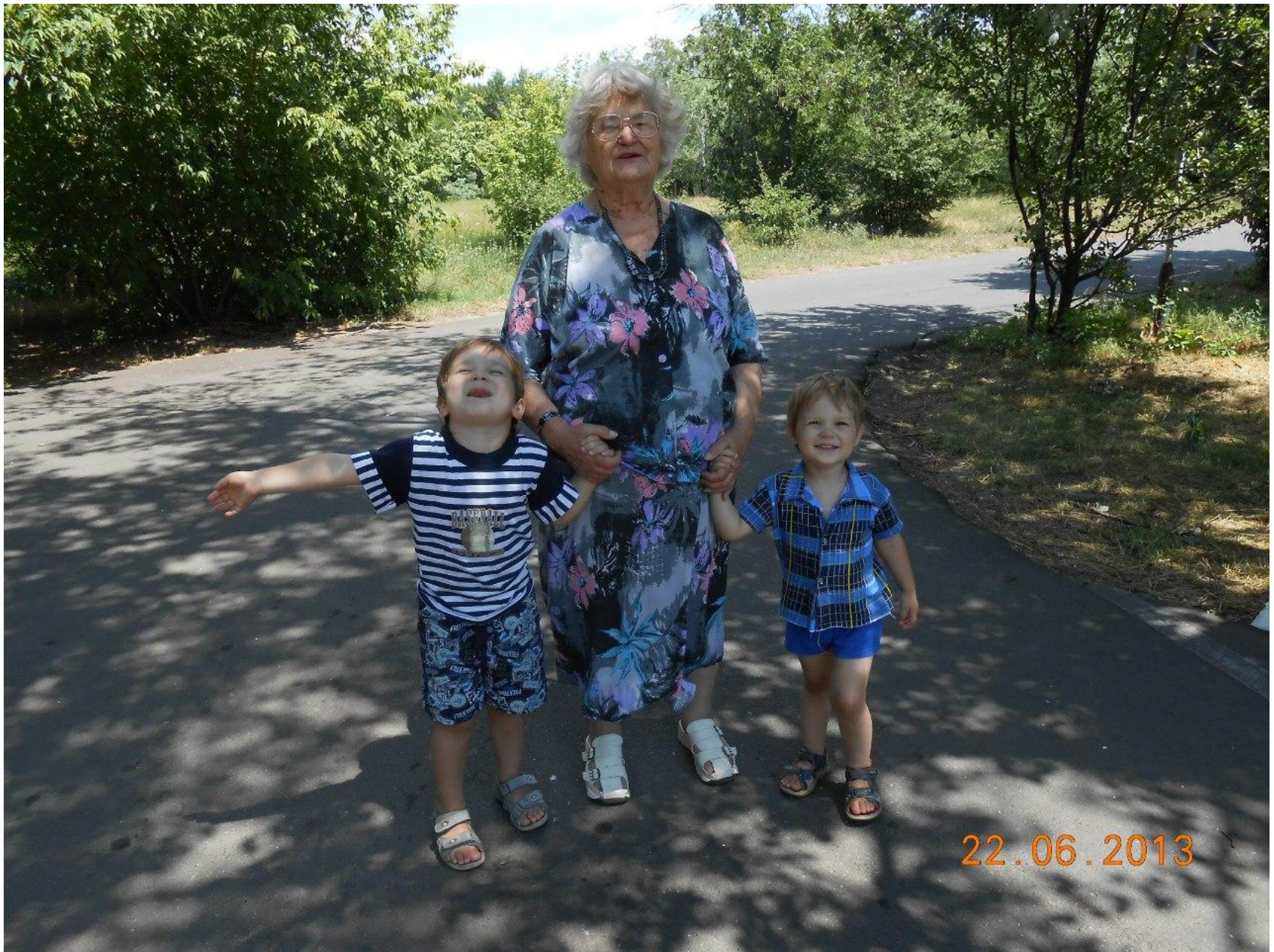
Бабушка часто гуляла с нами по парку