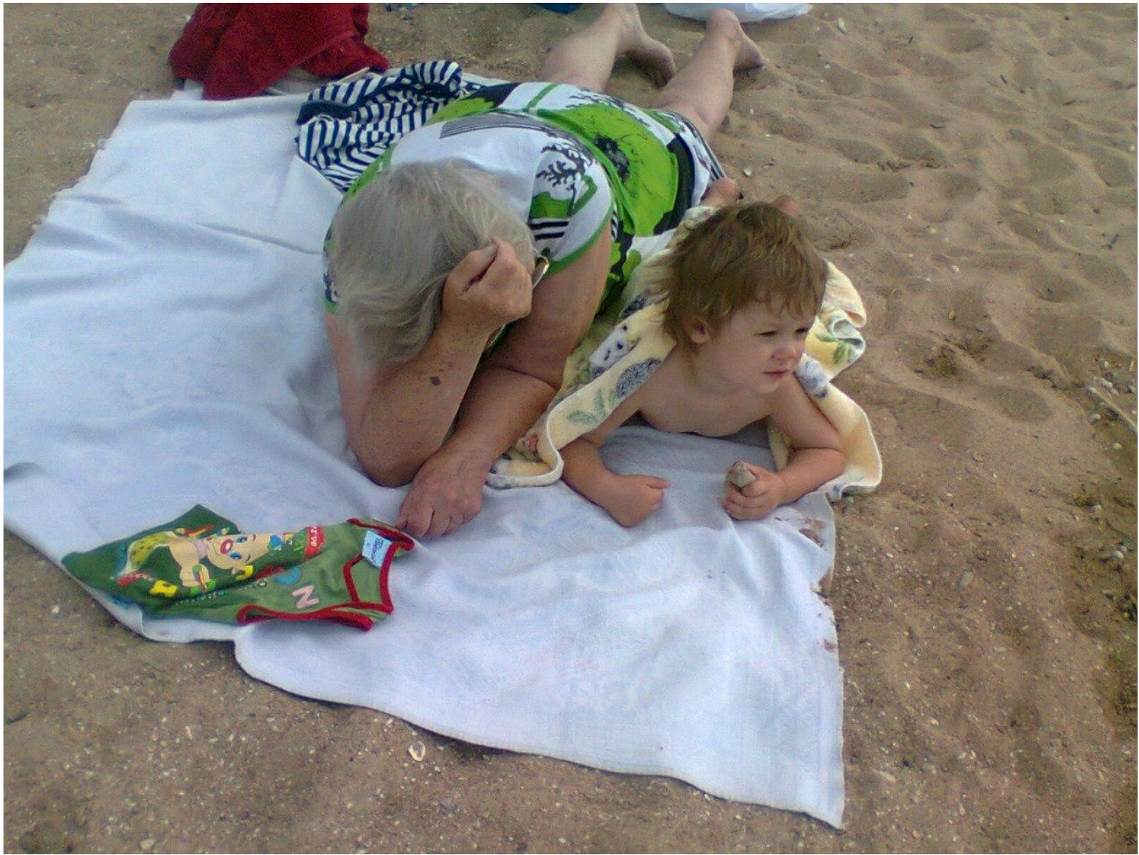
Водила нас на море