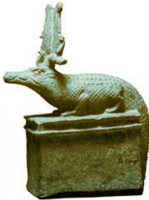
СЕБЕК – БОГ ВОДЫ