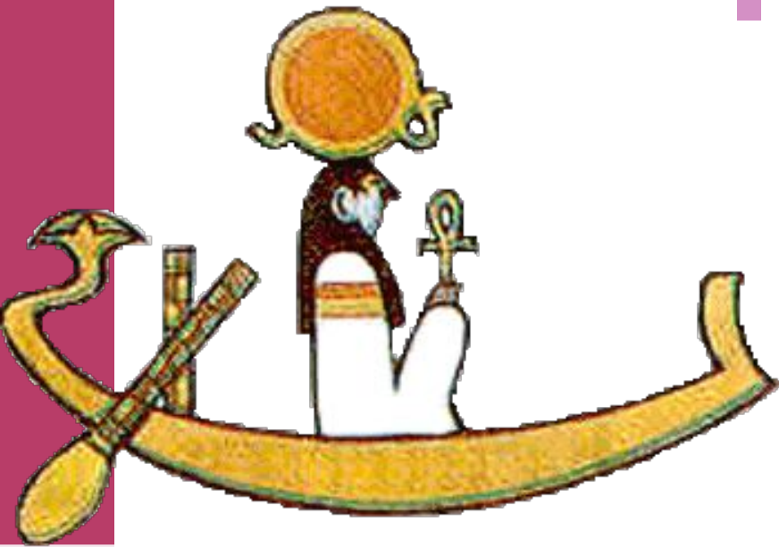
Бог Солнца -Амон-Ра