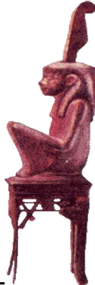
Богиня правды Маат