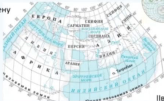
II век н.э. Изображение Земли на карте Птолемея