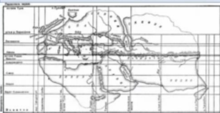
III век до н.э. Мир по Эратосфену

Определите, на какой из трех карт изображена наибольшая по площади территория, а на какой – наименьшая. Укажите признак (признаки) по которому вы это определили.