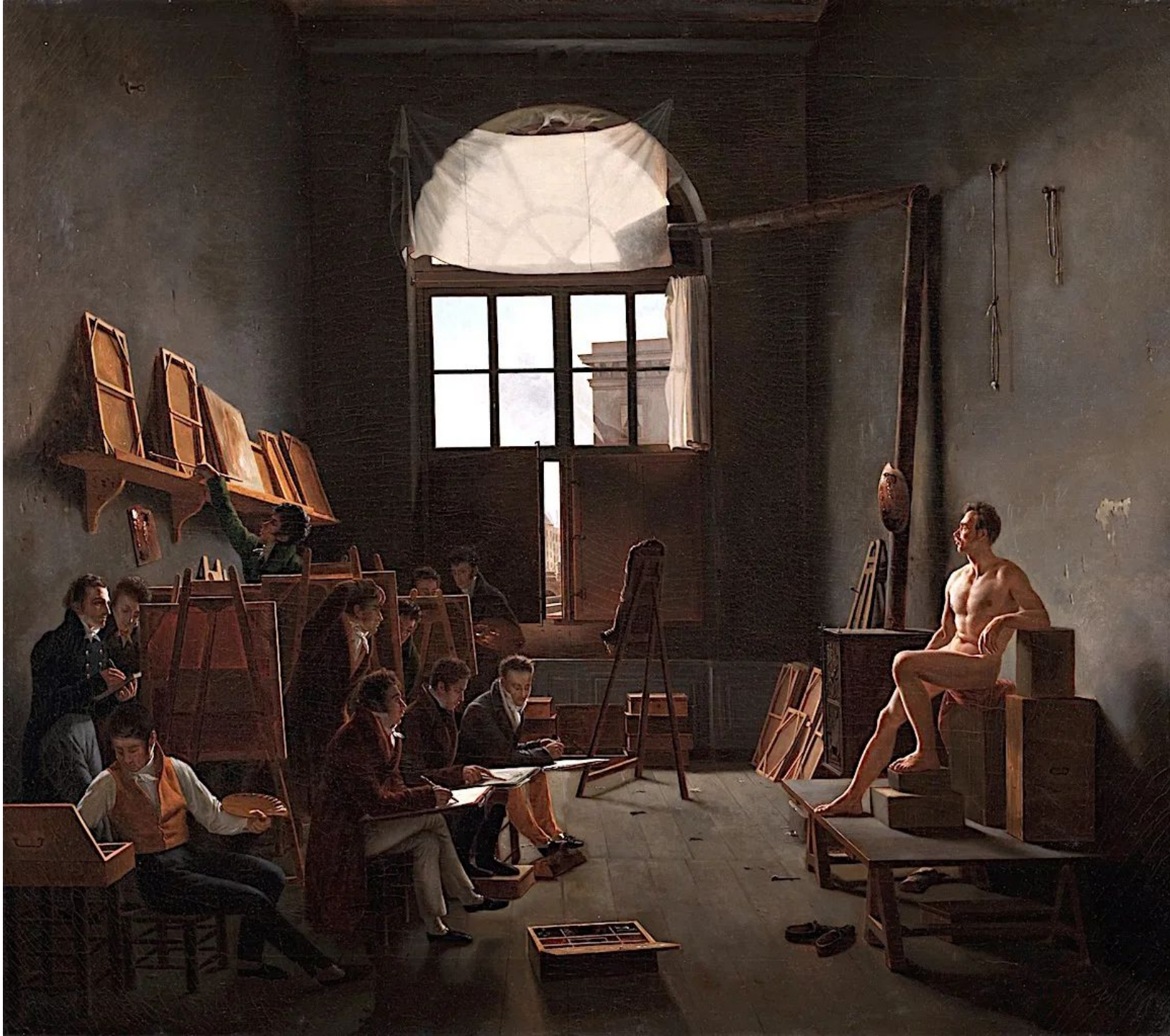
картина Леона- Матье Кошро «Интерьер мастерской Давида»,