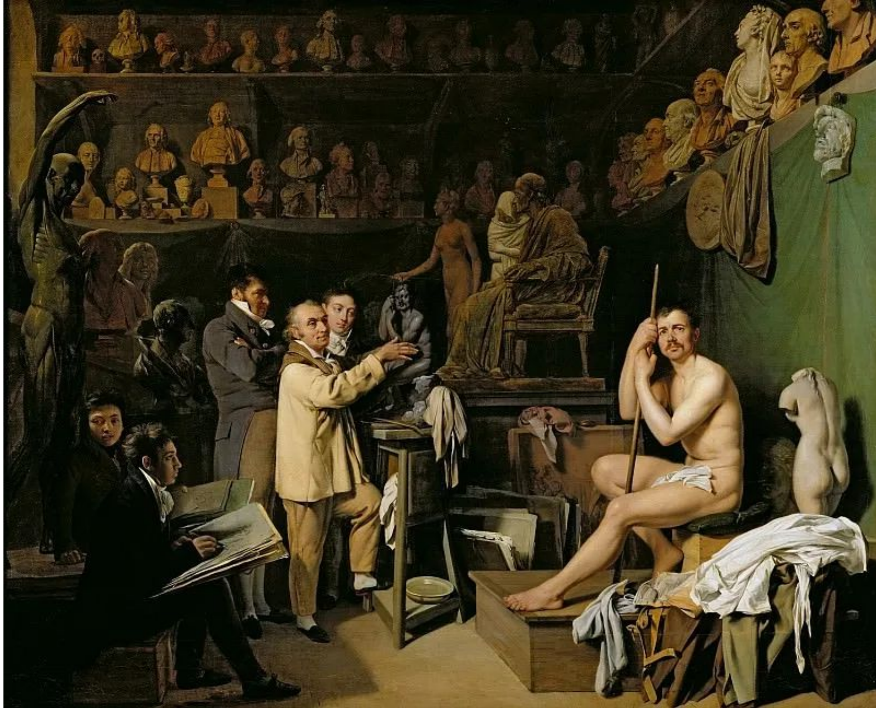
интерьер мастерской Гудона начала XIX в