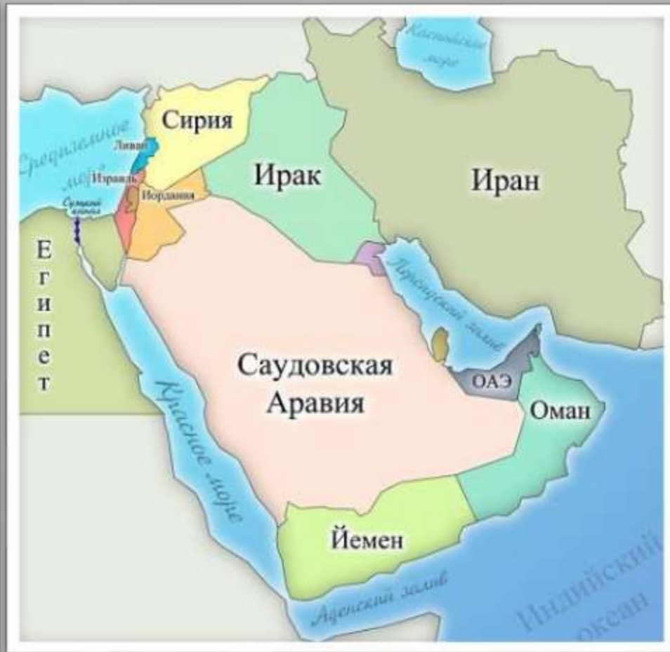
Ближний Восток в 1950-е гг.

Особенно ощутимой утратой для Великобритании стал распад её колониальной империи, предотвратить который власти страны были не в силах. Осенью 1956 г. британское правительство, стремясь помешать национализации Египтом Суэцкого канала, втянуло страну в войну против этого государства. Это вызвало массовое движение протеста в Великобритании и за её пределами. Эта война поставила на грань развала Британское Содружество Наций (с 1947 г. - Содружество), связанную с Великобританией договорами группу её бывший колоний. Убедившись в бесперспективности политики силы, парламент Великобритании в 1959 г. был вынужден признать распад Британской империи.