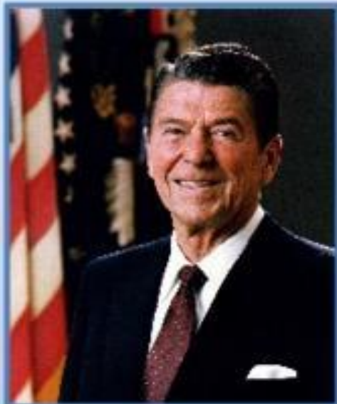
США Рональд Рейган (1981—1989)