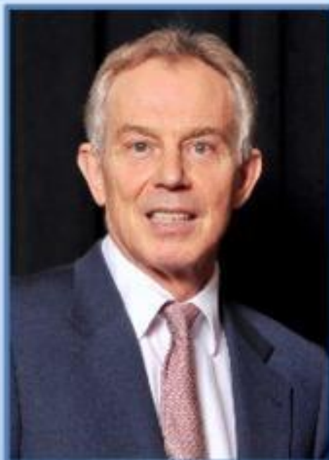
Великобритания Энтони Блэр (1997—2007)