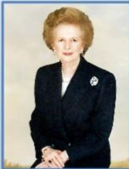
Великобритани я Маргарет Тэтчер