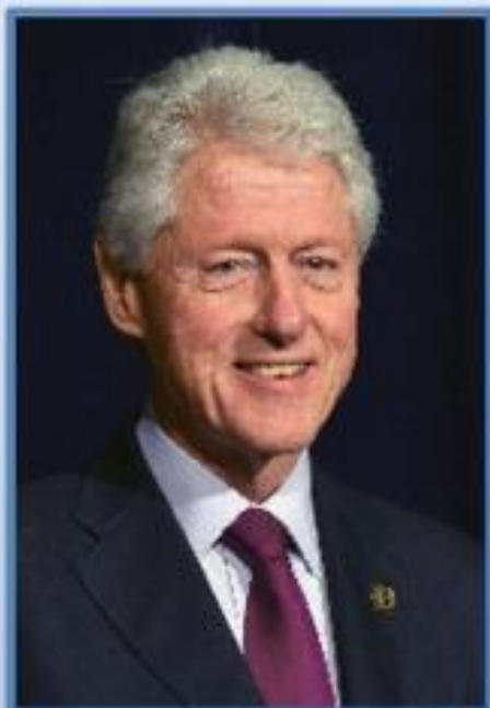
США Билл Клинтон (1993—2001)

Приход к власти политиков «третьего пути» в 1990-е гг. — начале 2000-х гг.