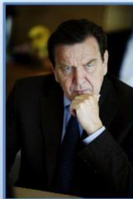
ФРГ Герхард Шрёдер (1998—2005)