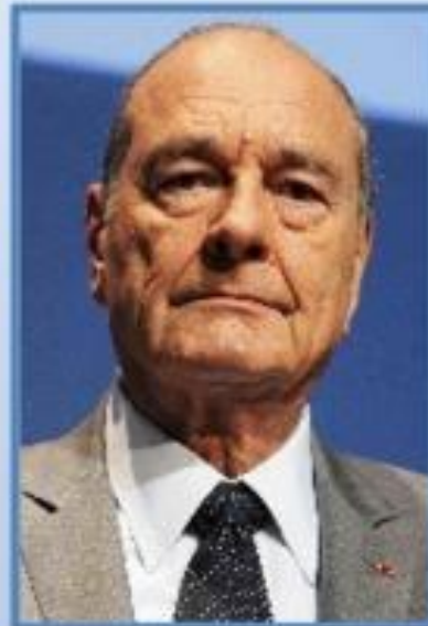
Франция Ж. Ширак (1986—1988)