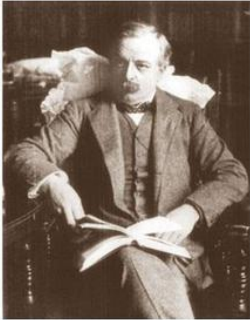
Дэвид Ллойд Джордж