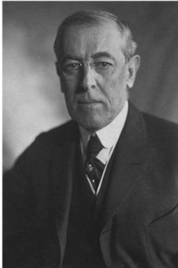
Томас Вудро Вильсон 28-й президент США