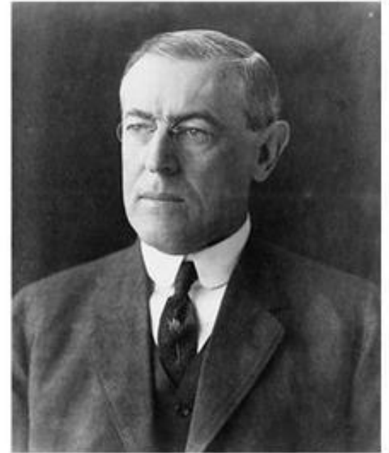
То́мас Вúдро Вильсон