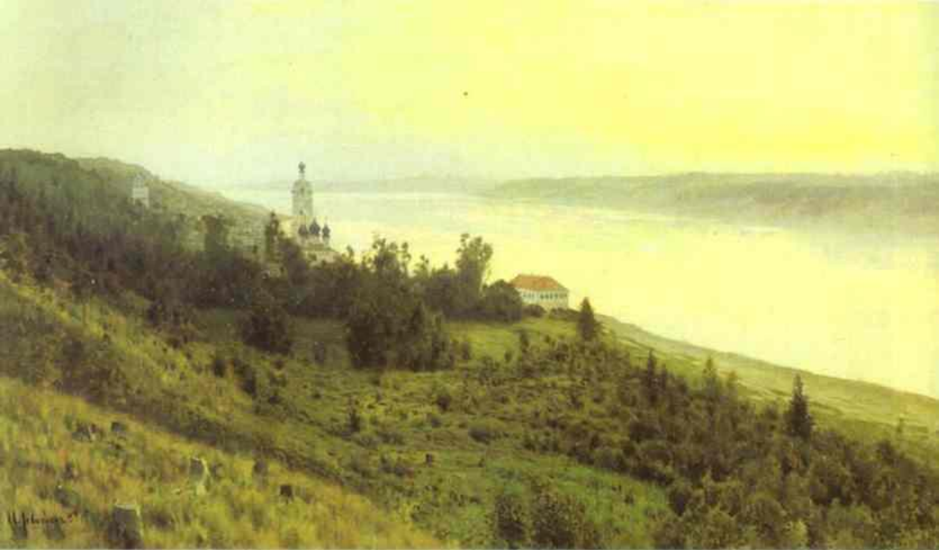
Исаак ЛЕВИТАН (1860 — 1900) Вечер. Золотой Плѣс