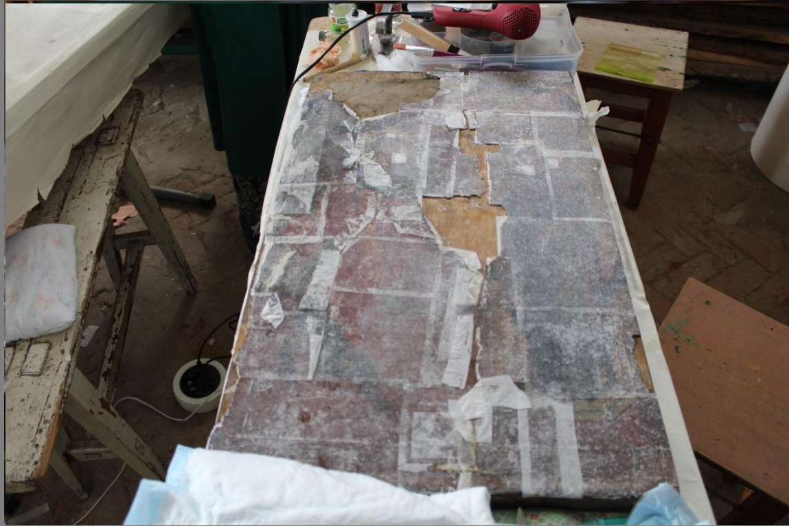
Лицевая сторона в косом свете до реставрации