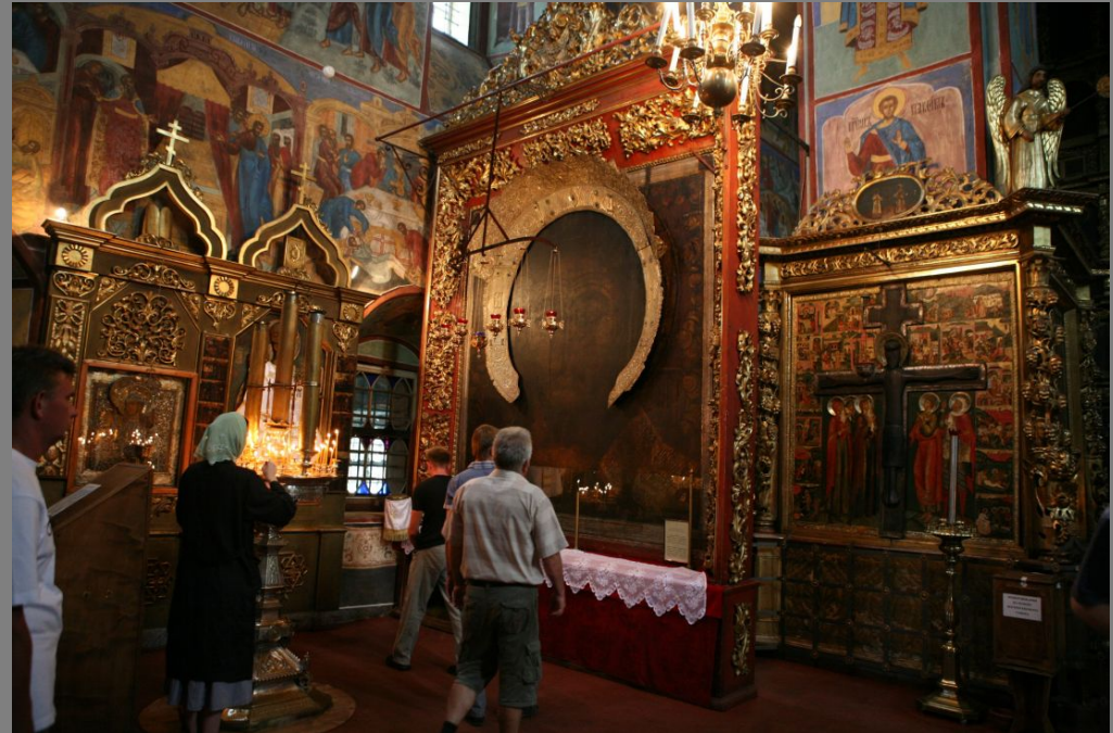
Одна из наиболее почитаемых икон собора – огромный трехметровый поясной образ Спаса Всемиловитого, созданный, по преданию Дионисием Глушицким.