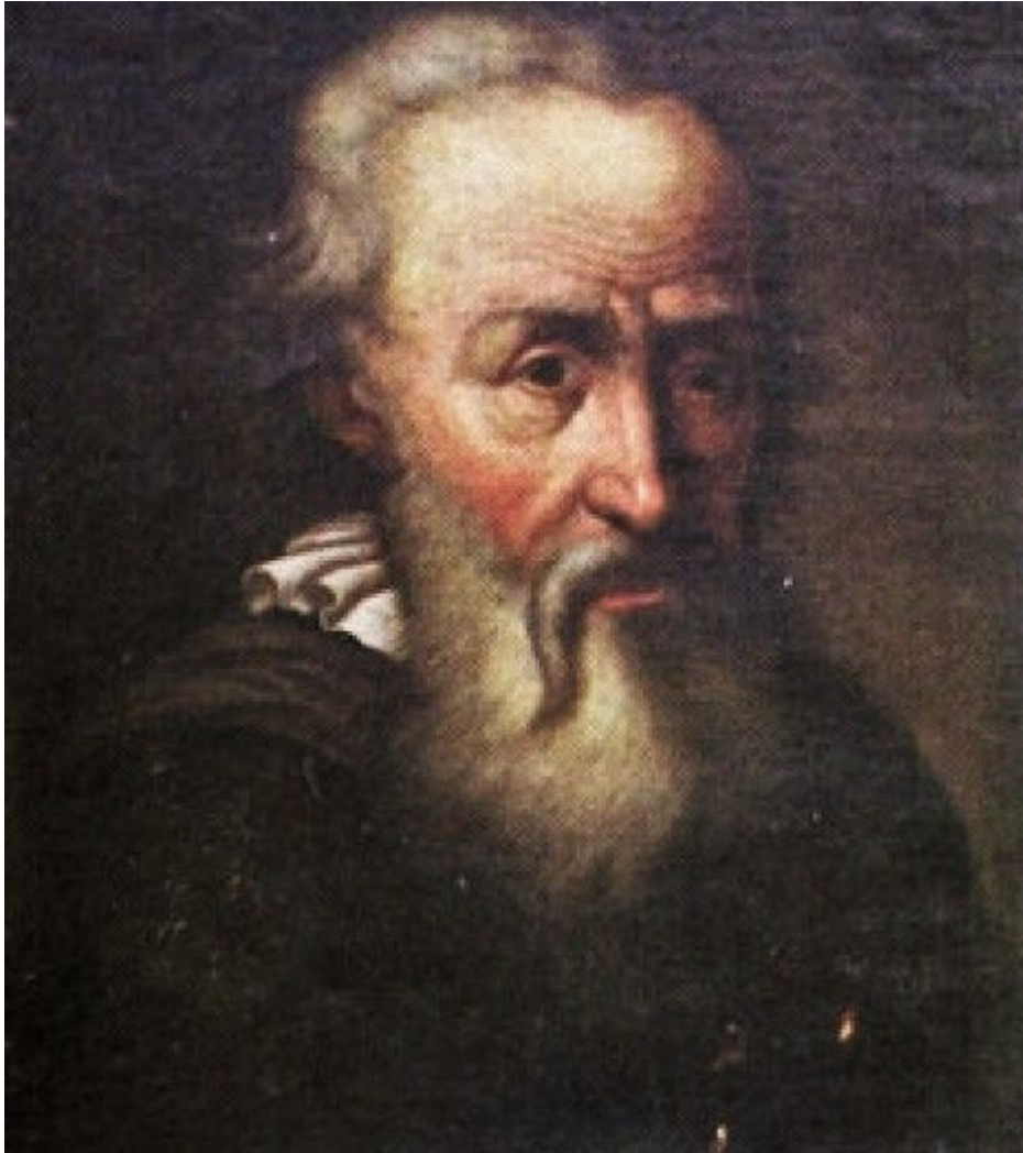
Василь Костянтин Острозький

Українська шляхта підтримувала об'єднання Литви й Польщі, сподіваючись у такий спосіб здобути для себе більше привілеїв. У житті тогочасної України особливе місце посідав рід Острозьких, Костянтин Острозький та його молодший син залишалися символом самобутності Русі-України.