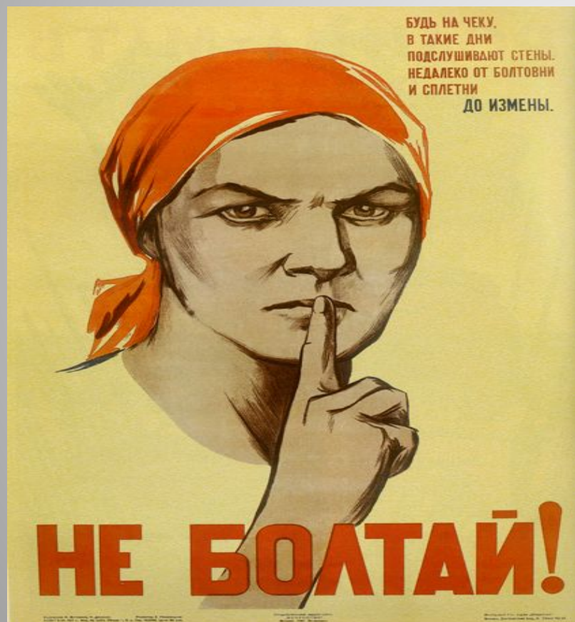
Плакат « Не болтай».