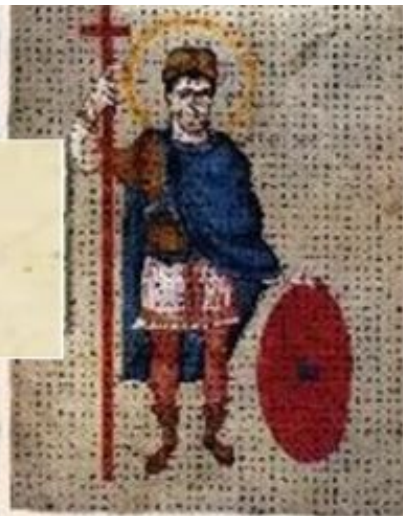
Людвиг Благочестивый, викингская миниатюра. 840 г.

это процесс распада крупных государств на мелкие феодальные владения