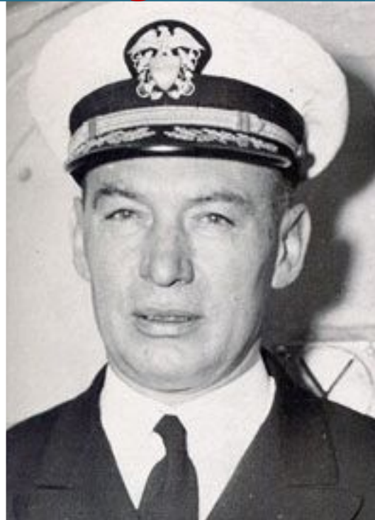
Роскоу Хилленкоттер США Директор Центральной разведки