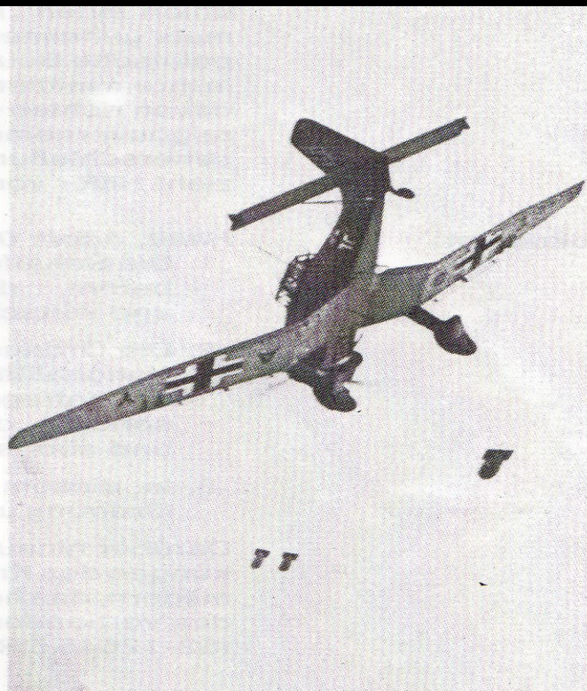
Angriff auf Polen