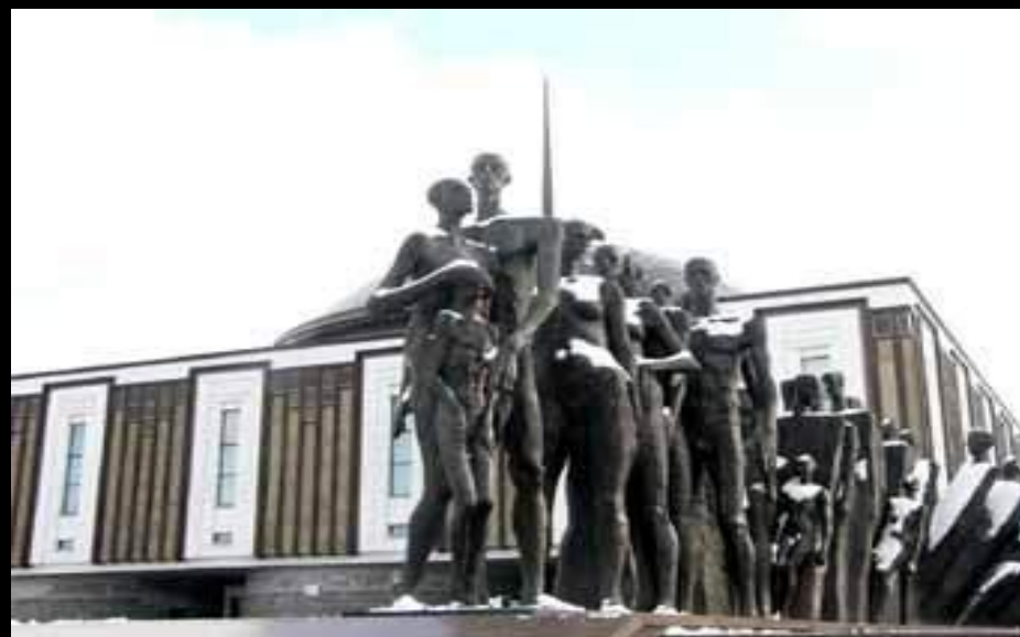
Москва. Поклонная гора