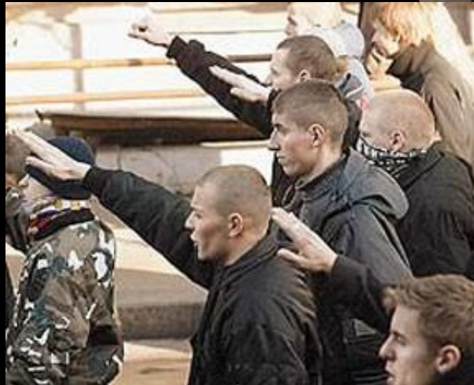
Фашизм и современная молодёжь