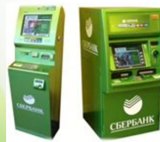
Устройства самообслуживания (банкоматы, терминалы)