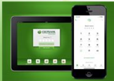
Мобильное приложение Сбербанк онлайн (планшет, смартфон)