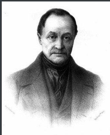
Огюст Конт (1798-1857)

француз философы, әлеуметтанушысы, философиядағы позитивизм мектебінің негізін қалаушы Еңбегі - «Позитивтік саясат жүйесі, немесе Адамзат діндері негіздері туралы социологиялық трактат»