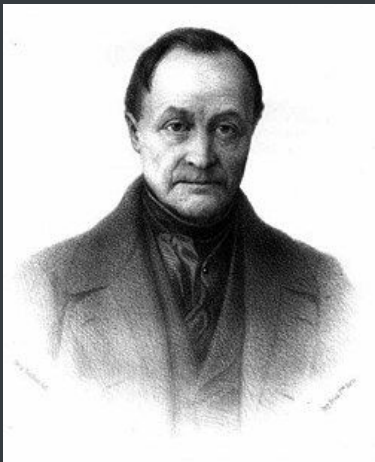
Огюст Конт (1798-1857)

француз философы, әлеуметтанушысы, философиядағы позитивизм мектебінің негізін қалаушы Еңбегі - «Позитивтік саясат жүйесі, немесе Адамзат діндері негіздері туралы социологиялық трактат»