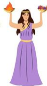
Гестія (домашнє вогнище)