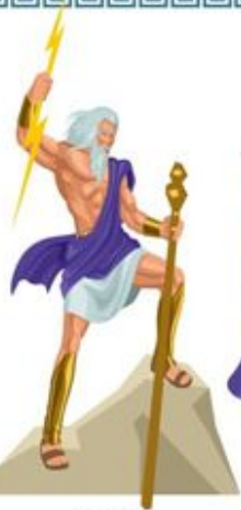
Зевс (грім, блискавка)