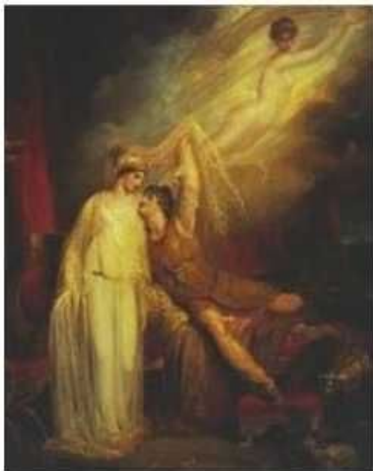
Гвідо Рені. Викрадення Єлени