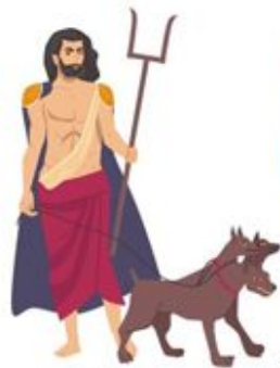
Аїд (підземне царство)