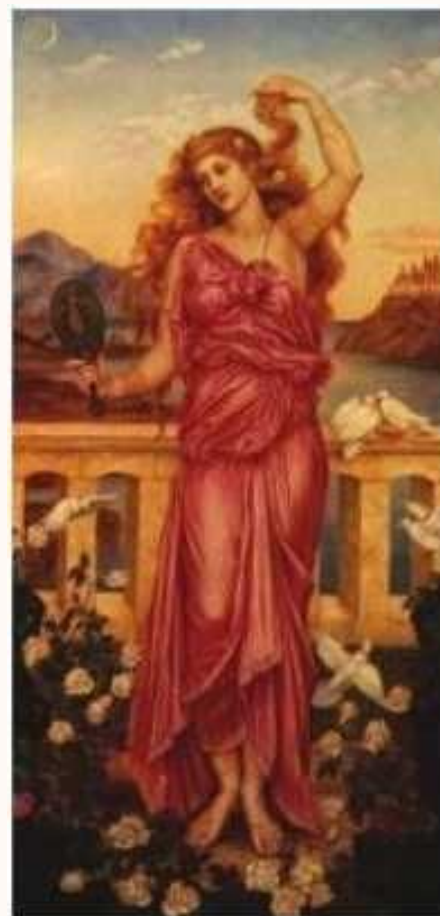
Гюстав Моро. Єлена Троянська