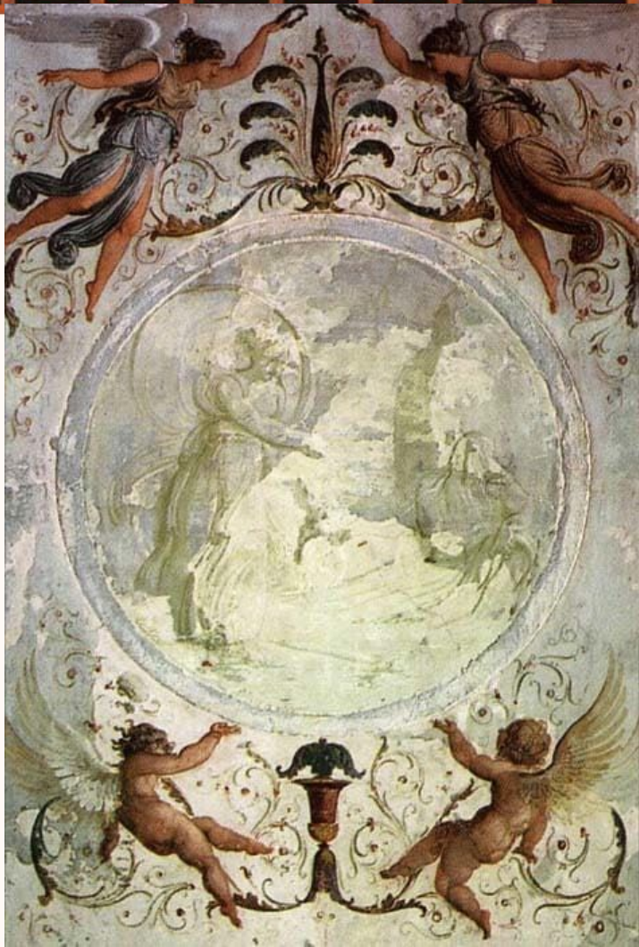
Фетіда занурює Ахілла у води Стікса (Франческо Хайєс)