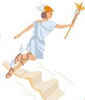
Гермес (торгівля, вісник богів)