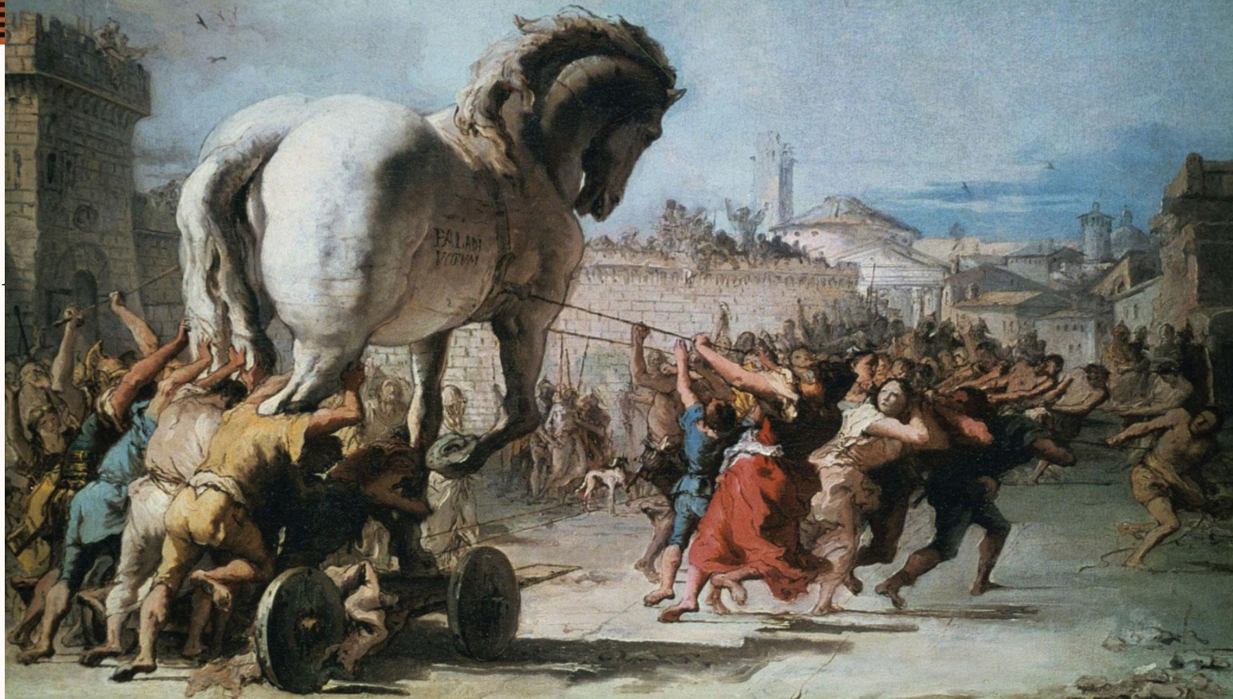
Д. - Б. Т'єполо. «Перевезення троянського коня до Трої»