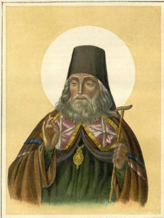
НОВОПРАСЛАВЛЕННЫЙ ЧУДОТВОРЕЦЪ ГЛАВНЫЙ ТИХОНЪ ЗАДОНСКІЙ. Епископъ Воронежскій и Селенскій. Родился въ 1724 году скончался 1783 году Августа 13 го дня. Облагоденъ Центромъ Москвы 18 го Июля 1861 г. Изд. въ Тип. К. Яковлева