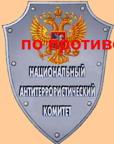
Схема координации деятельности по противодействию терроризму в Российской Федерации