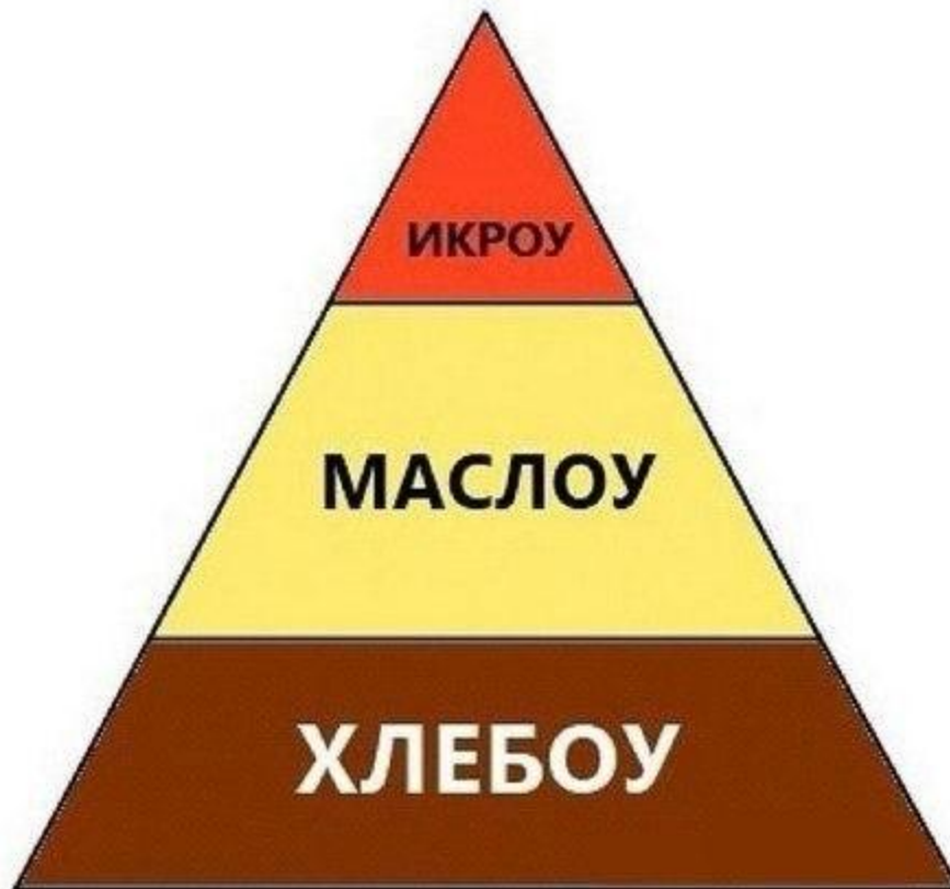
Пирамида Маслоу, первая версия