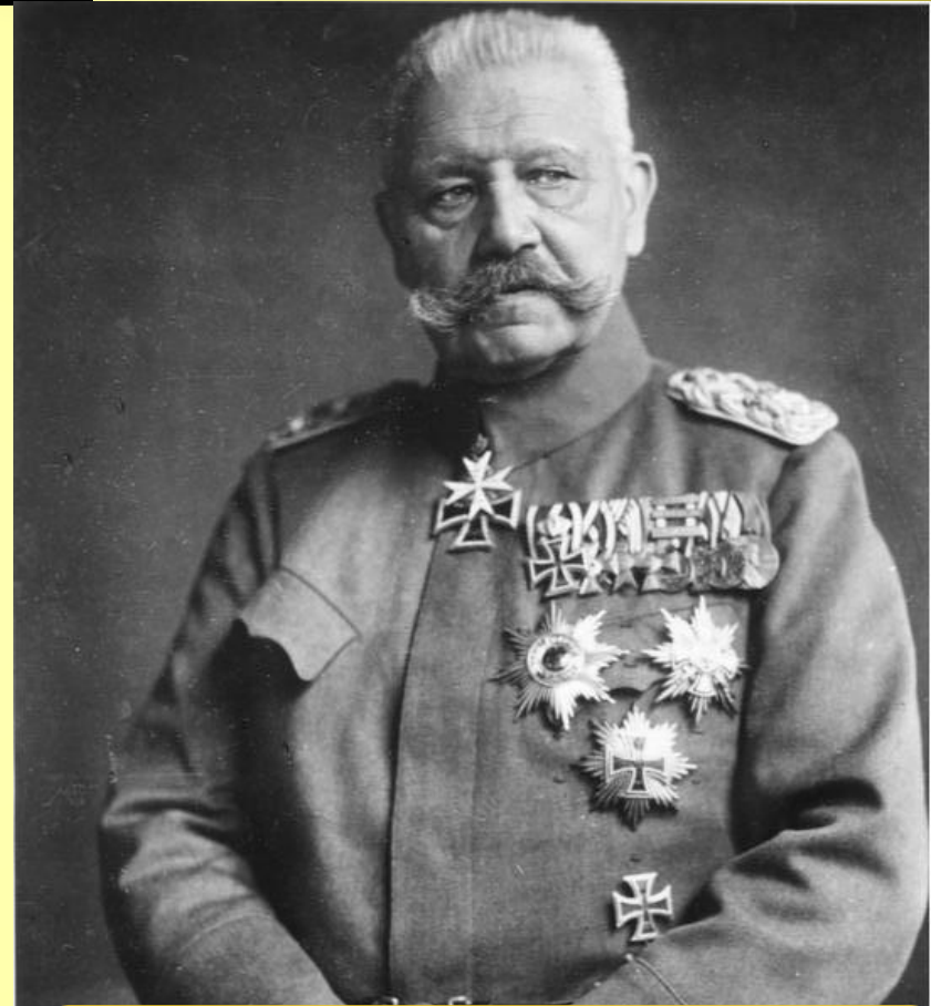
Пауль фон Гинденбург (1919-1934 гг.) – военный деятель и первый президент Германии