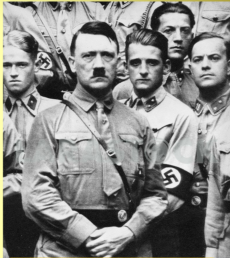
Адольф Гитлер (1934- 1945 гг.) – политический деятель, фюрер (вождь), НСДАП, диктатор нацистской Германии