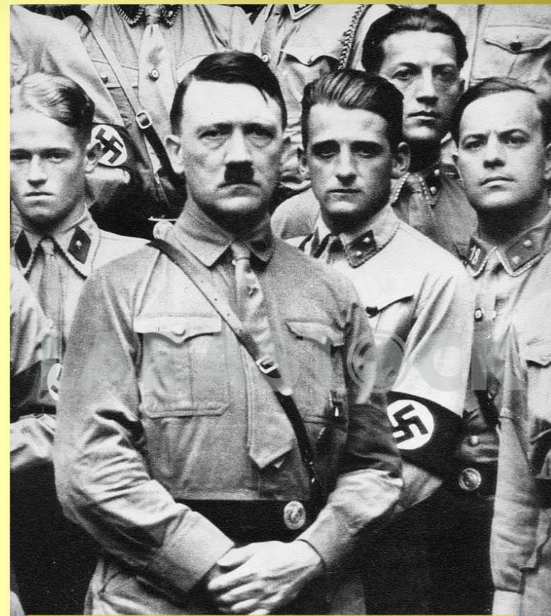
Адольф Гитлер (1934- 1945 гг.) – политический деятель, фюрер (вождь), НСДАП, диктатор нацистской Германии