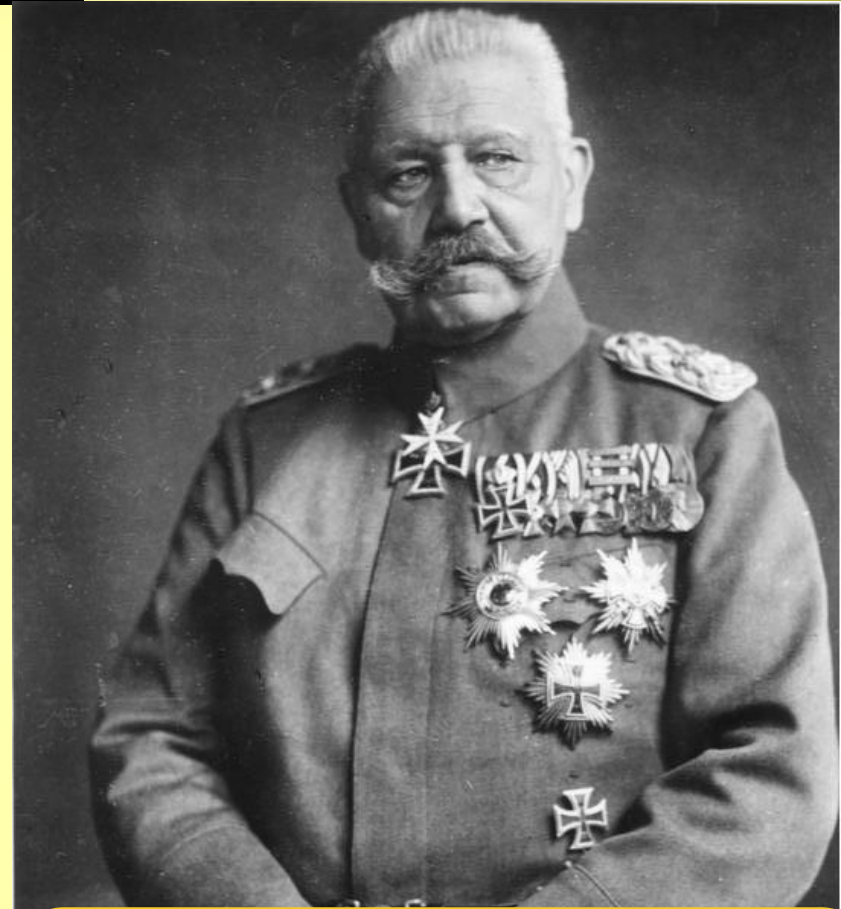
Пауль фон Гинденбург (1919-1934 гг.) – военный деятель и первый президент Германии