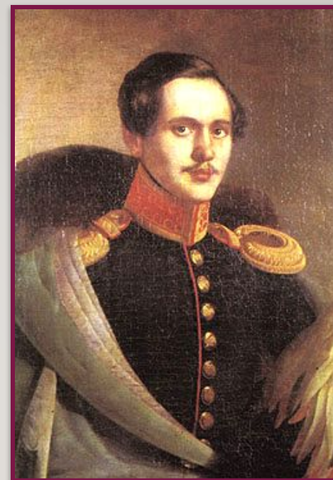
Лермонтов в ментике лейб-гвардии Гусарского Полка. 1837 г.

Не желая начинать все сначала, по совету родственников он поступил в школу гвардейских подпрапорщиков и кавалерийских юнкеров, где провёл, по его словам, "два страшных года". В школе господствовала военная муштра, запрещалось чтение художественной литературы. Но и в этих условиях Лермонтов урывками и тайком продолжал свои литературные занятия, работал над романом "Вадим" из эпохи пугачёвского восстания. Окончив школу, Лермонтов получил офицерский чин и был определён в лейб-гвардии гусарский полк, стоявший в Царском Селе.