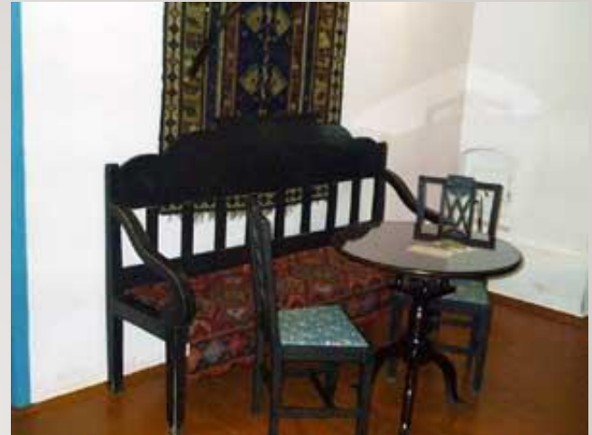
Стол, за которым работал Лермонтов