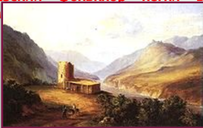
Кавказский вид с саклей. Картина М.Ю. Лермонтова. 1837 г.

Лермонтов успел сильно измениться в нравственном отношении. Впечатления от природы Кавказа, жизни горцев, кавказский фольклор легли в основу многих произведений Лермонтова.