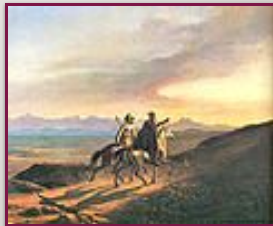
Кавказский вид с саклей. Картина М.Ю. Лермонтова. 1837 г.