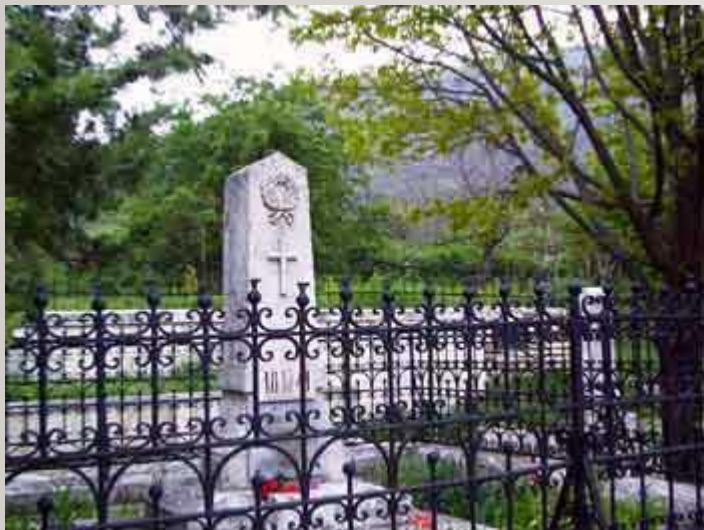
Место первоначального погребения М. Ю. Лермонтова