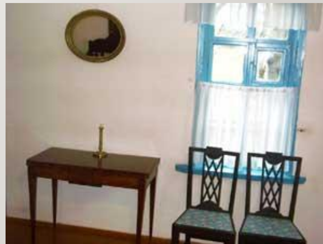
Лермонтовская половина дома