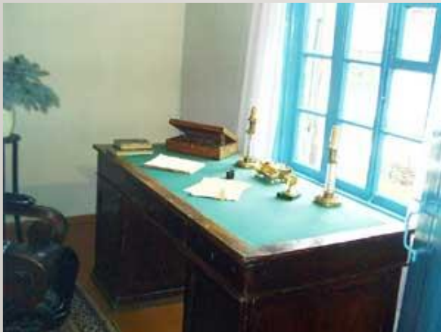
Стол и кресло Лермонтова