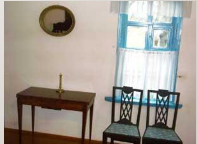
Лермонтовская половина дома