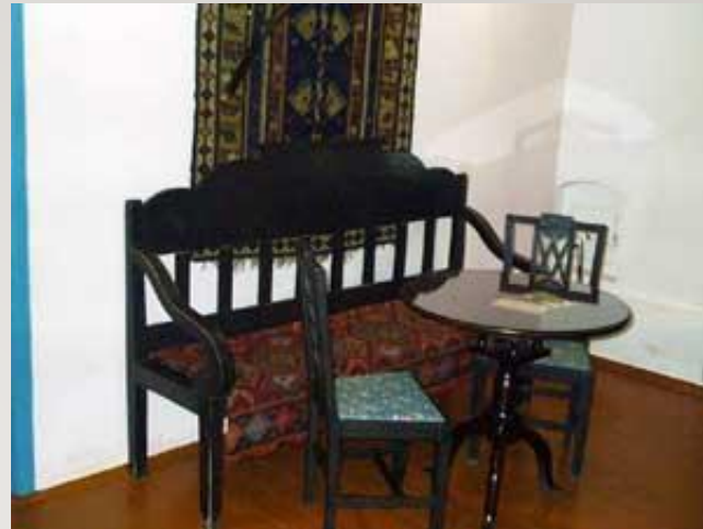
Стол, за которым работал Лермонтов