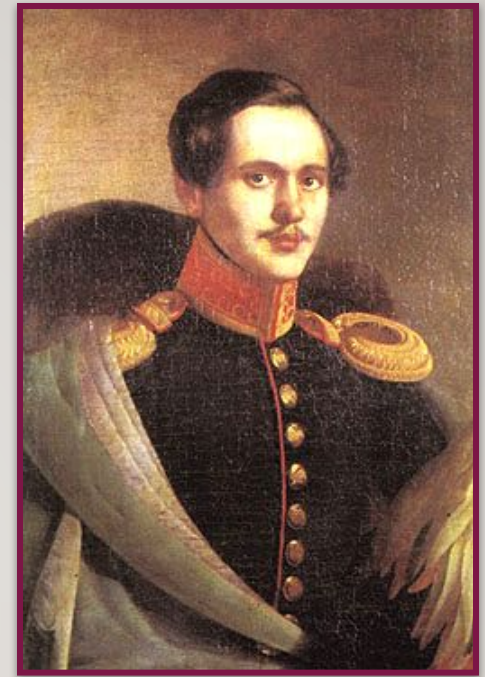
Лермонтов в ментике лейб-гвардии Гусарского Полка. 1837 г.

Не желая начинать все сначала, по совету родственников он поступил в школу гвардейских подпрапорщиков и кавалерийских юнкеров, где провёл, по его словам, "два страшных года". В школе господствовала военная муштра, запрещалось чтение художественной литературы. Но и в этих условиях Лермонтов урывками и тайком продолжал свои литературные занятия, работал над романом "Вадим" из эпохи пугачёвского восстания. Окончив школу, Лермонтов получил офицерский чин и был определён в лейб-гвардии гусарский полк, стоявший в Царском Селе.