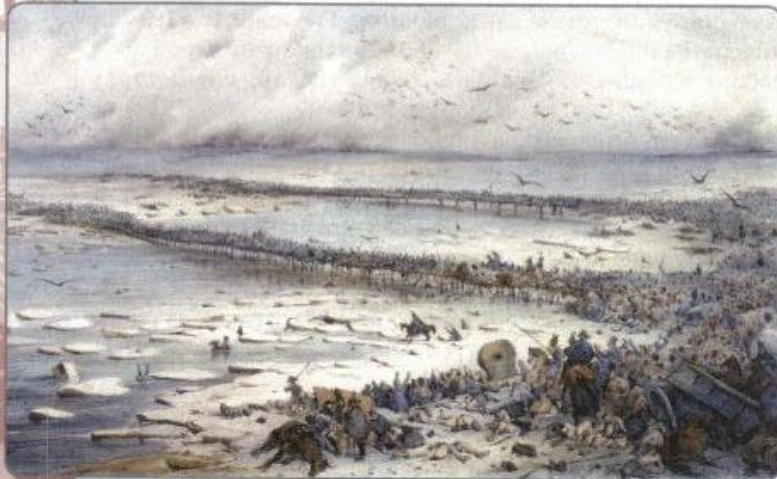
Переправа через Березину 29 ноября 1812 г. Литография В. Адама

Пребывая в Москве в течение месяца и уже понимая свою обречённость, Наполеон трижды пытался начать переговоры о мире с Александром I, но ответа на свои письма так и не получил.