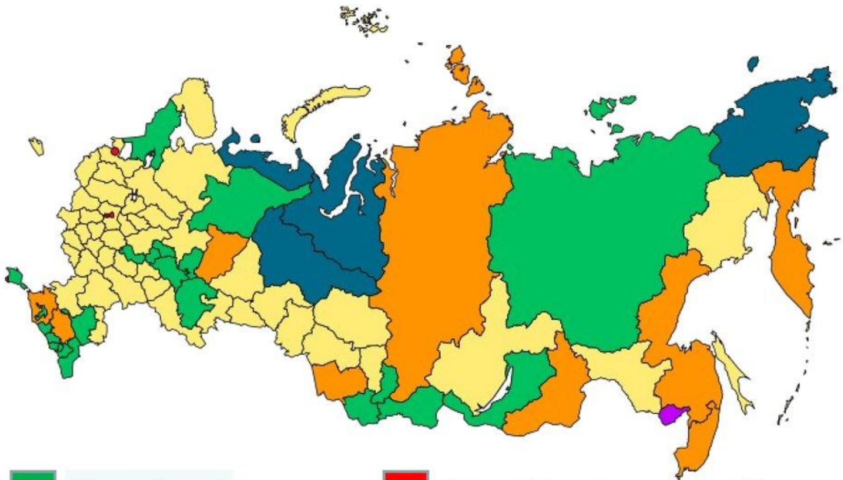
Субъекты Российской Федерации (85)