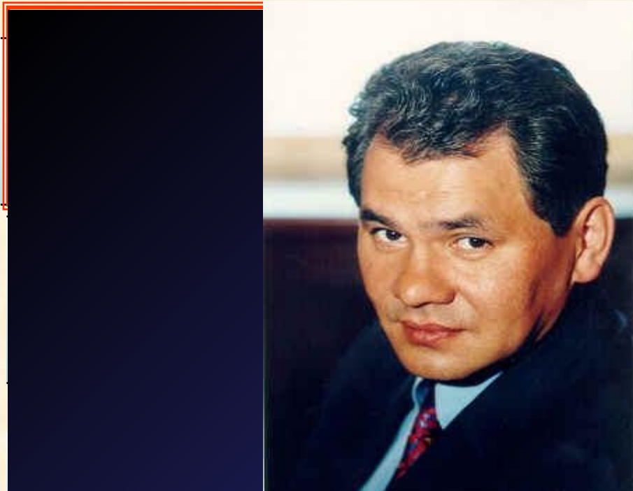
ШОЙГУ Сергей Кужугетович